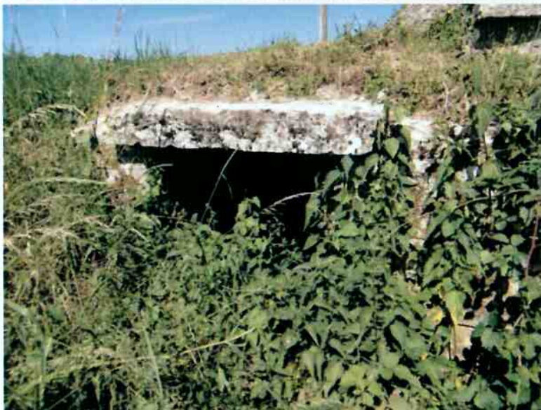
Élévation aval de l'ouvrage de décharge