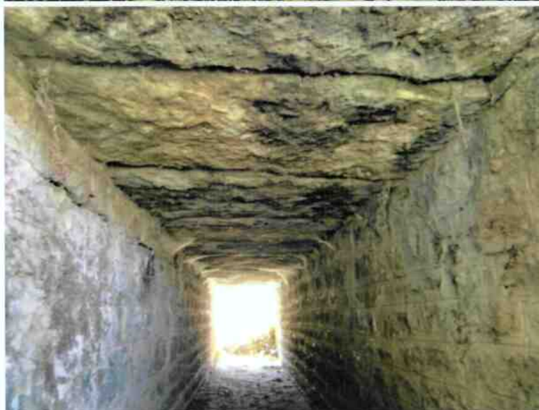
intérieur de l'ouvrage de décharge