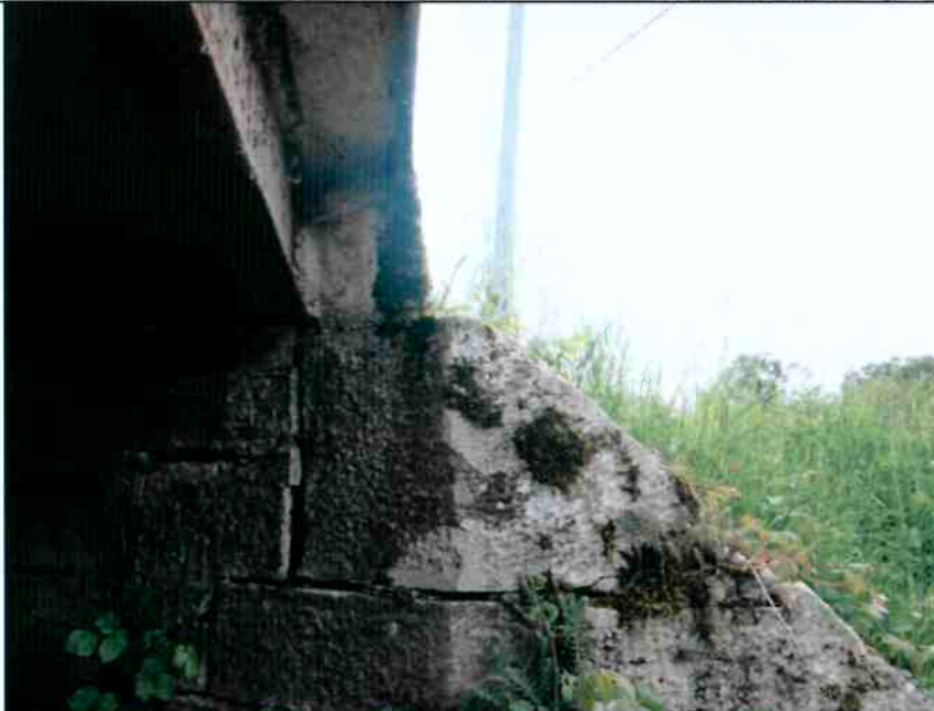
Déchaussement de la pierre supérieure de la chaîne d'angle