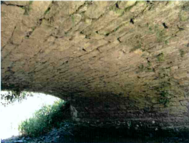
vue de la voûte