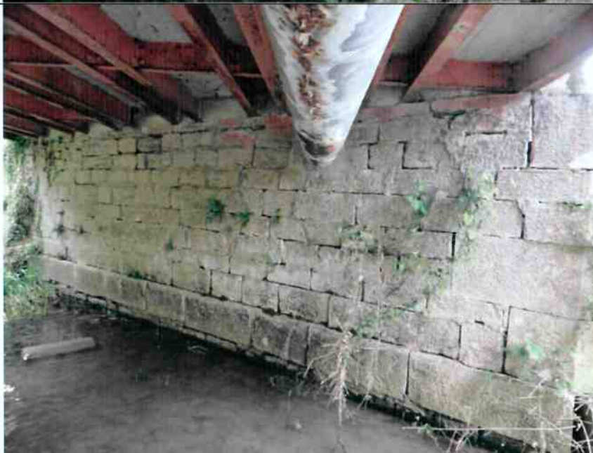
Vue générale de la culée côté rive droite. Bombement en pied