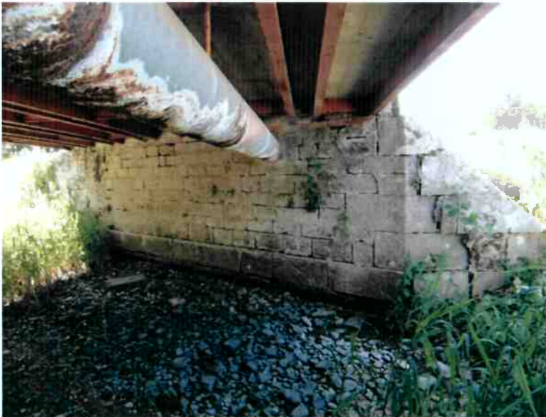
état de La Rondaine en période d'assec.

Les travaux seront effectués en période de basses eaux et à l'intérieur d'une zone protégée par des batardeaux. Afin de ne pas déstabiliser la structure, les terrassements seront effectués par phases d'environ 4 m de longueur pour une surface d'environ 1.00 m 2 soit un volume de 4 m 3 de matériaux évacués par phases. Les eaux à évacuer seront des eaux résiduelles d'infiltration. Avec une pompe de 100 m 3 /h, on peut supposer la réalisation d'un bassin de 2.00 m x 2.00 m x 0.40 m. La surface du bassin et la capacité de la pompe sera déterminée en fonction de l'eau à évacuer présente en phase de travaux. Au démarrage des travaux, le dispositif en place sera validé par la Police de l'Eau lors de la réunion de démarrage des travaux.