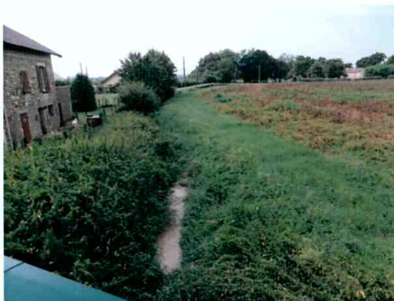
La Rondaine à l'aval de l'ouvrage