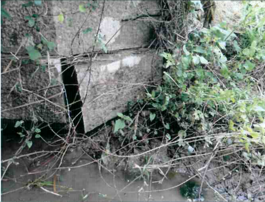
Déchaussement d'une pierre en partie basse du mur en retour