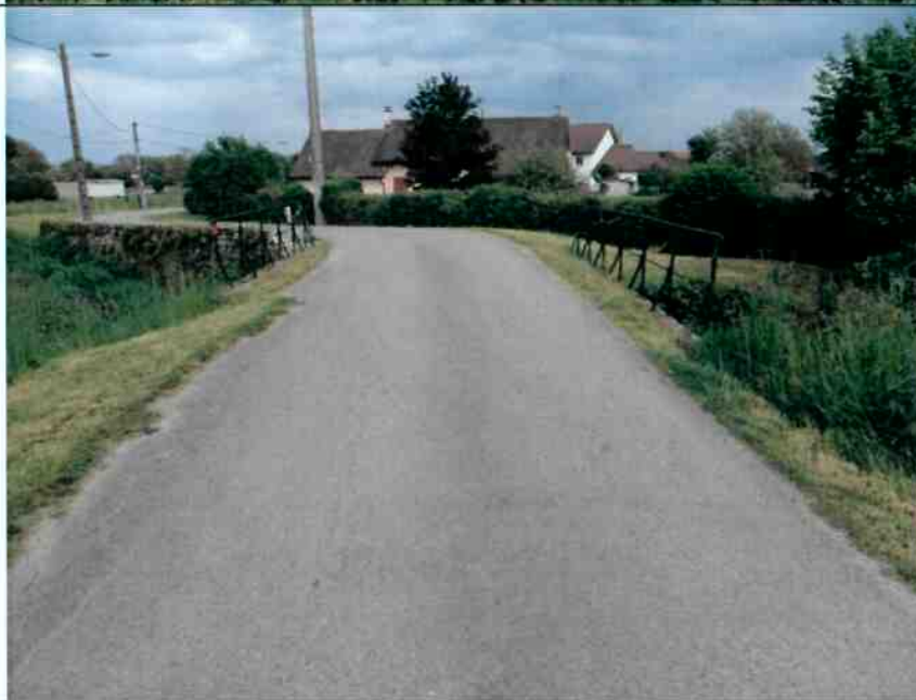
Vue générale de la chaussée depuis la rive droite