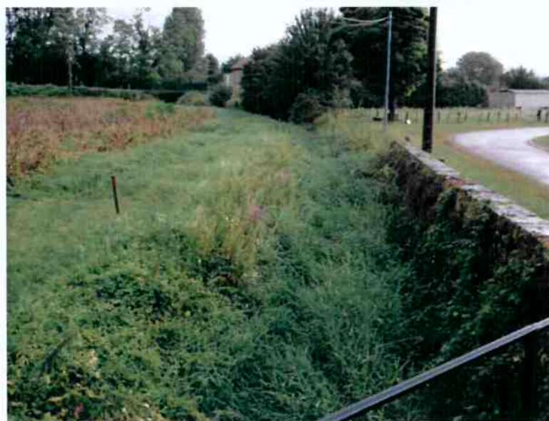
La Rondaine entre l'ouvrage n°2 de la RD38 et l'ouvrage à réhabiliter