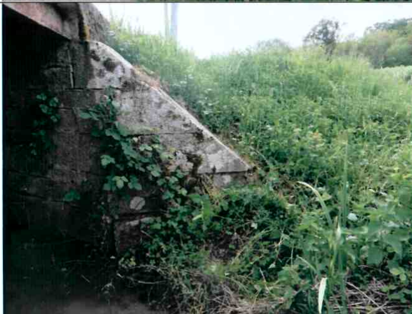
Désorganisation importante de la maçonnerie de la chaîne d'angle et du mur en retour amont rive droite