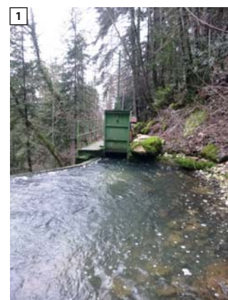
Retenue et Prise d'eau