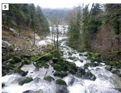
Tronçon court circuité Secteur aval cascades