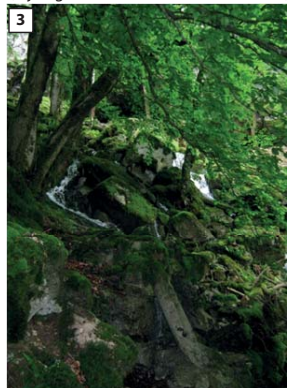
Emergences annexes (rejoignant le ruisseau en aval du seuil)