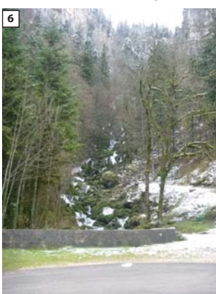
Tronçon court circuité Secteur de cascade