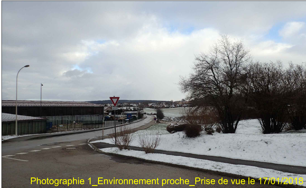
Photographie 1_Environnement proche_Prise de vue le 17/01/2018