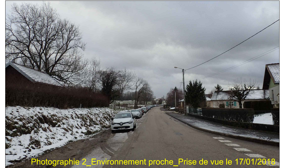
Photographie 2_Environnement proche_Prise de vue le 17/01/2018