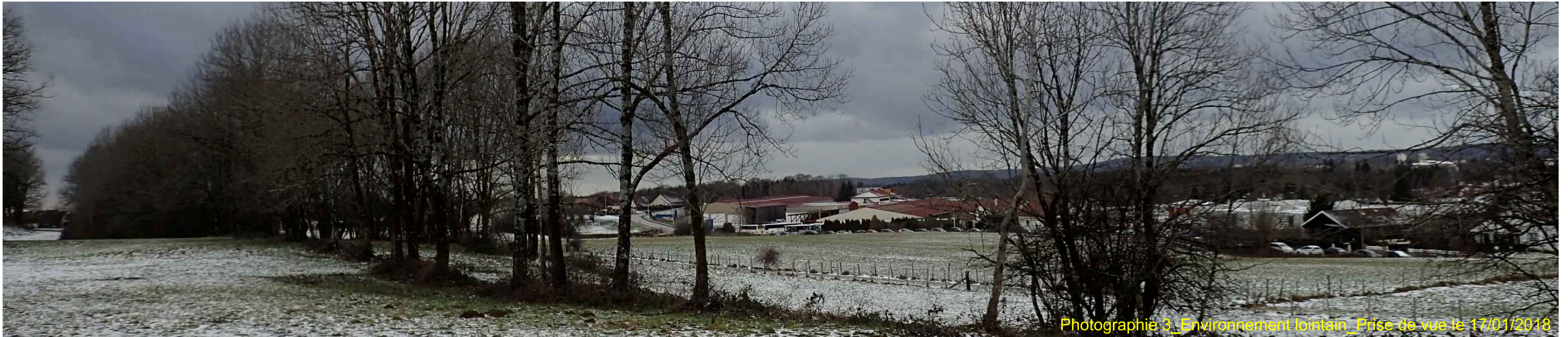
Photographie 3_Environnement lointain_Prise de vue le 17/01/2018