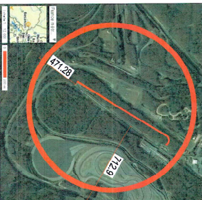
Vue Aérienne (Google Earth MAP de 18-01-2019)