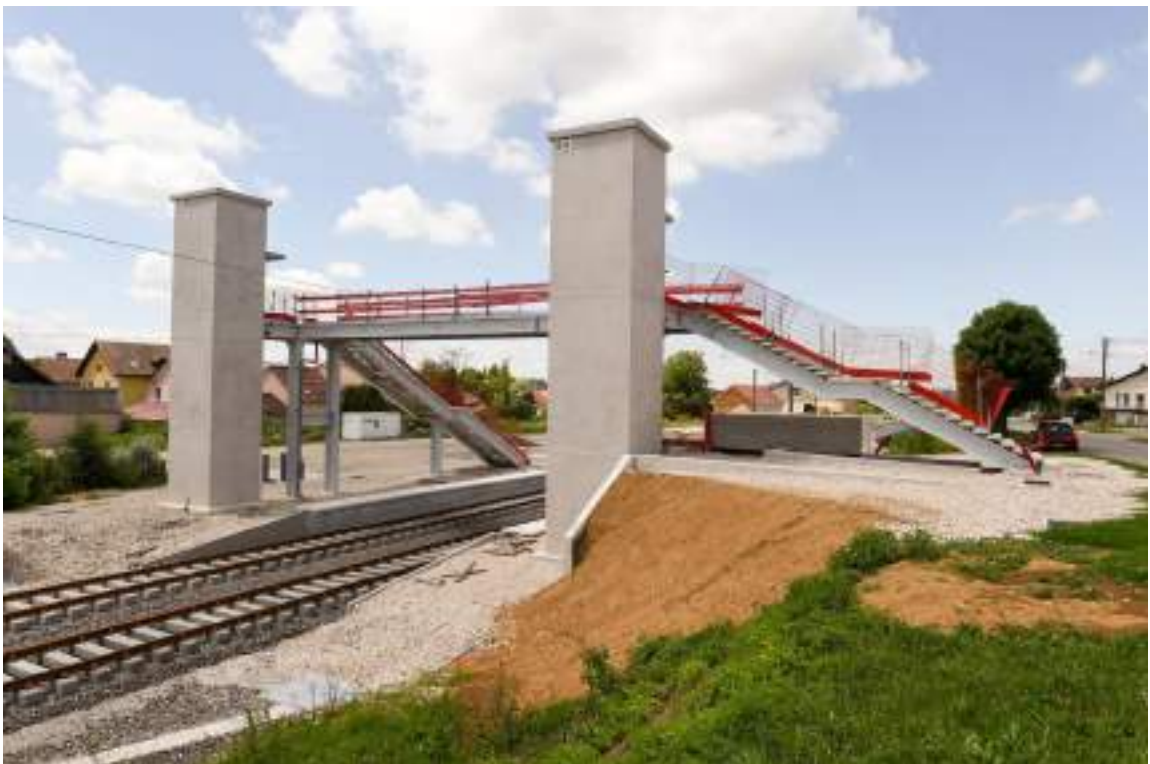
Passerelle de Grandvillars

Une passerelle interquartiers permettant un accès aux trains pour les personnes à mobilité réduite a été construite au niveau de l'ancienne gare.