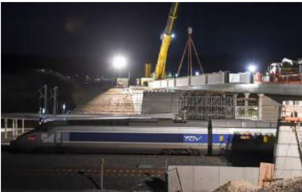
Pose du tablier de Meroux

Pour les usagers, ce pont rail permet in fine d'assurer une liaison quai à quai par ascenseur et par escalier. Et pour compléter le dispositif d'accès, un cheminement piéton assure également une liaison directe depuis le parking de la gare TGV jusqu'au futur quai TER . L'ouvrage de Meroux s'intègre au cœur de la gare de Belfort-Montbéliard TGV, telle que conçue par l'architecte Jean-Marie Duthilleul. L'ouvrage réalisé s'inscrit ainsi dans la continuité de l'existant, aussi bien au niveau des formes que des matériaux et des teintes.