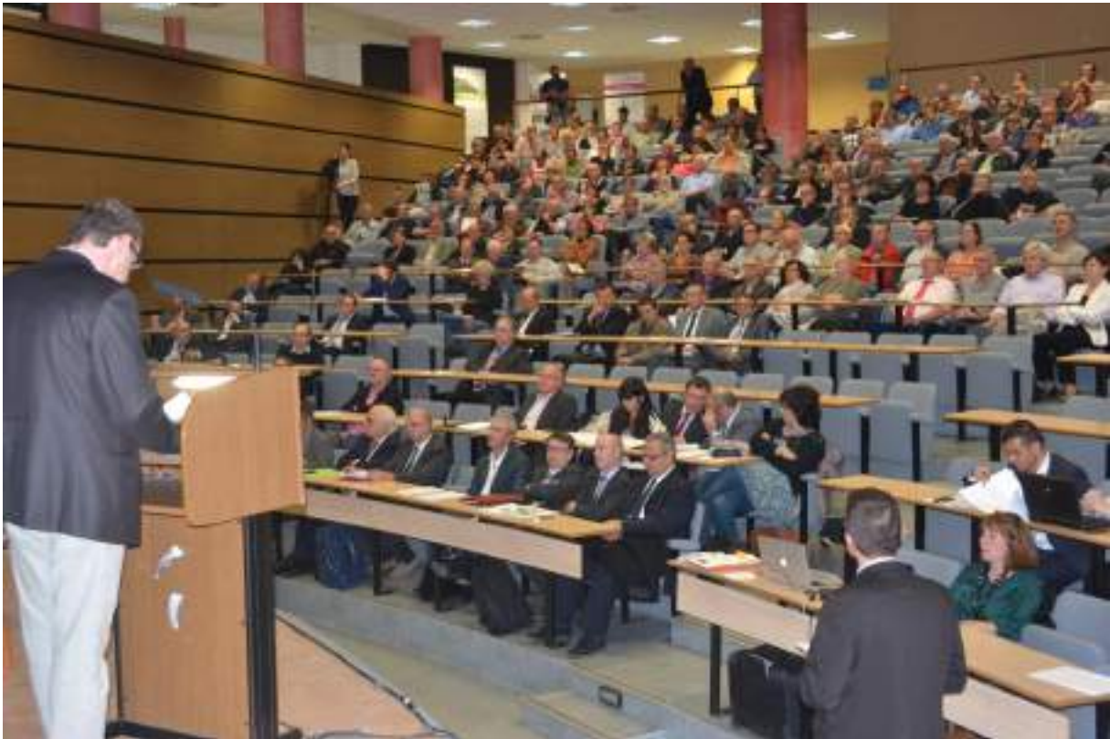
Réunion publique du 16 octobre 2014 à Sevenans

Pour préparer et travailler sur le projet de réouverture de la ligne Belfort-Delle, la Direction territoriale Bourgogne-Franche-Comté SNCF Réseau, maître d'ouvrage, est allée à la rencontre des élus et des riverains et a mené une enquête publique en 2015 . Ainsi, pour lancer cette phase de concertation, une réunion publique regroupant l'ensemble des partenaires et le public du territoire concerné par le projet a réuni 250 personnes à Sevenans le 16 octobre 2014.