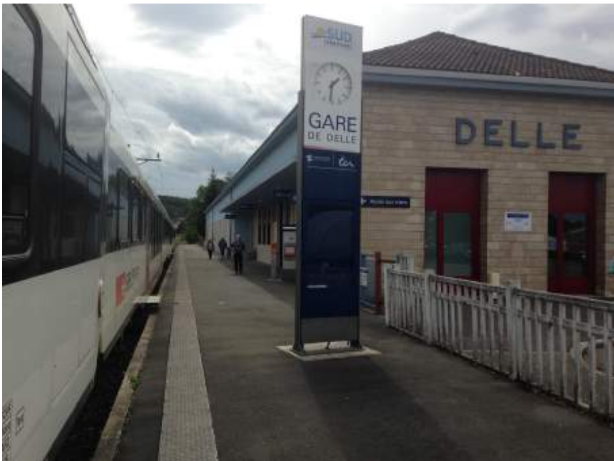
Gare de Delle

La gare de Delle, emblème de la renaissance de la ligne, est le parfait reflet de ce lifting intégral. Après le retrait de l'ancienne voie, est intervenue la construction d'un centre technique de 100 m 2 . Il s'agit d'un poste informatique qui assure la commande des signaux et des aiguillages le long de la ligne, en interface avec le poste de Porrentruy, via la fibre optique.