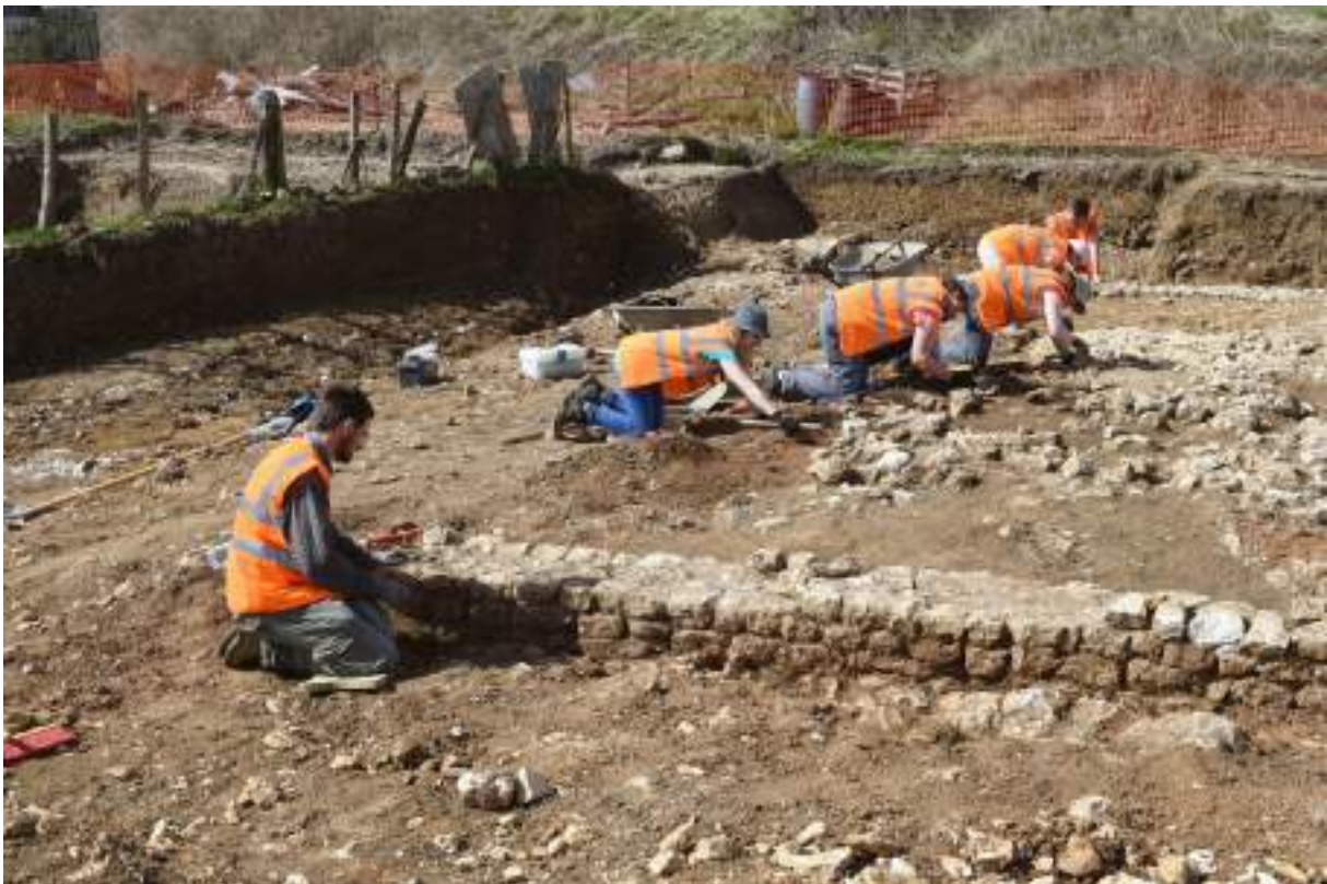
Fouilles à Danjoutin

Trois communes ont été concernées par l'archéologie préventive : Bourogne, Danjoutin et Delle. Les diagnostics et les fouilles sur ces lieux ont été réalisés par l'INRAP. Une villa gallo-romaine a ainsi été découverte à Danjoutin.