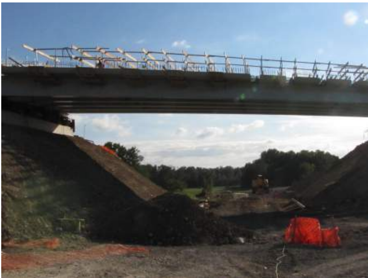
Travaux pour la création du nouveau pont route en substitution de la suppression du PN 11 de Bourogne - Charmois