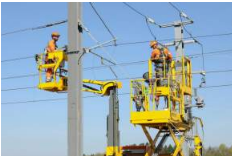
Travaux sur les caténaires à la halte de Meroux