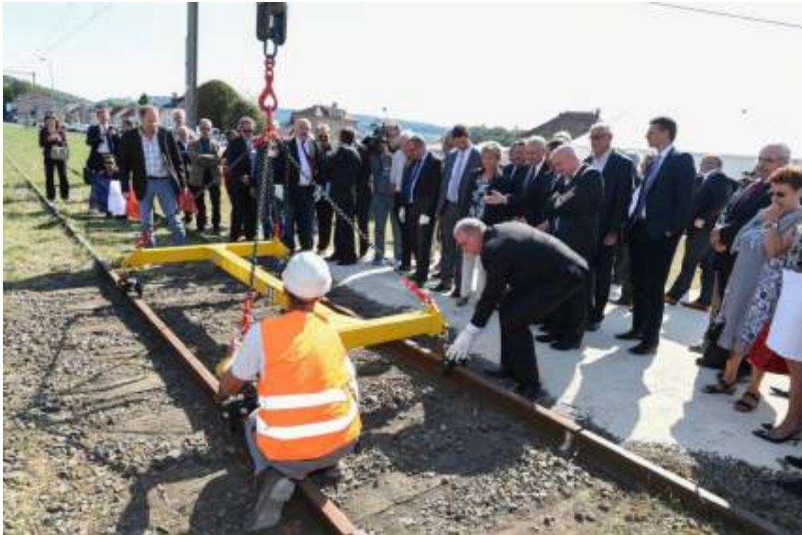
Lancement des travaux -10 septembre 2015

Après la Déclaration d'Utilité Publique en juillet, le projet de liaison ferroviaire franco-suisse est entré dans une phase concrète avec le lancement des travaux, le 10 septembre 2015, et la dépose de l'ancienne voie.