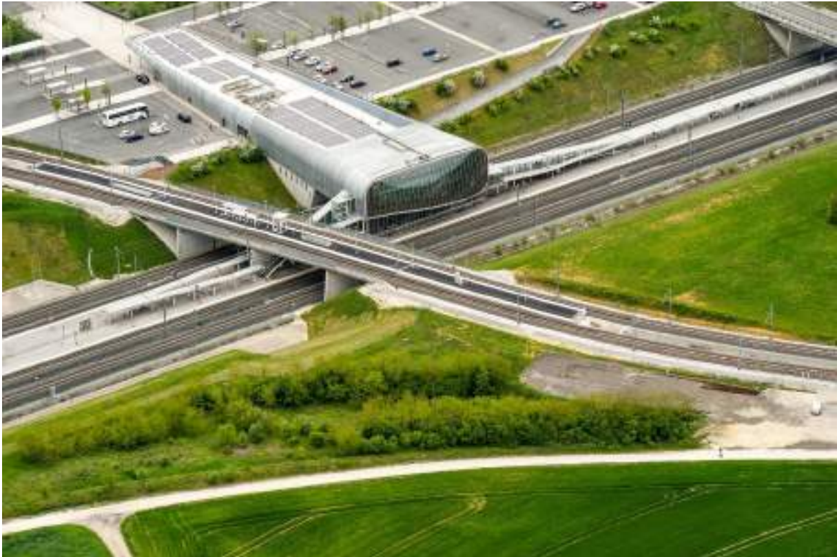
Gare de Belfort-Montbéliard TGV

La réouverture de la ligne Belfort-Delle aux voyageurs représente une réelle opportunité pour le territoire grâce à la connexion à la LGV Rhin-Rhône en gare de Belfort-Montbéliard TGV.