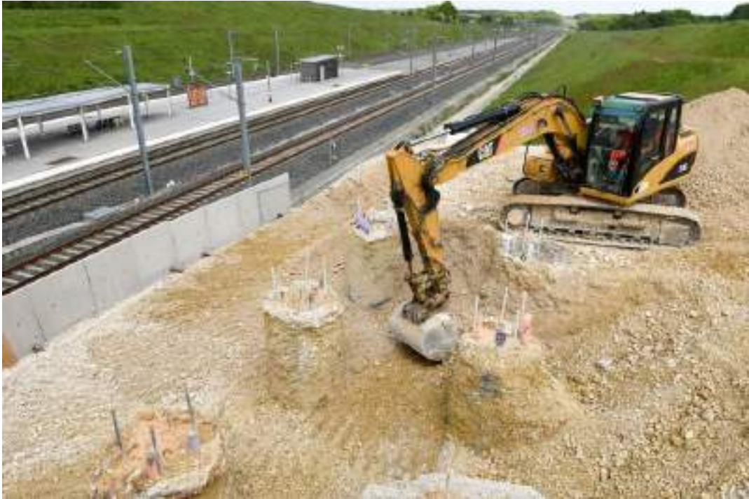
Terrassement pour préparer le pont rail de Meroux

Pour les usagers, ce pont rail permet in fine d'assurer une liaison quai à quai par ascenseur et par escalier. Et pour compléter le dispositif d'accès, un cheminement piéton assure également une liaison directe depuis le parking de la gare TGV jusqu'au futur quai TER . L'ouvrage de Meroux s'intègre au cœur de la gare de Belfort-Montbéliard TGV, telle que conçue par l'architecte Jean-Marie Duthilleul. L'ouvrage réalisé s'inscrit ainsi dans la continuité de l'existant, aussi bien au niveau des formes que des matériaux et des teintes.