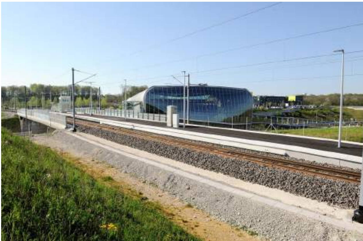
Halte ferroviaire de Meroux

Enfin, un passage souterrain a été créé à l'extrémité du quai TER pour permettre aux voyageurs de rejoindre directement le parking des taxis et le parvis sans passer par la gare.