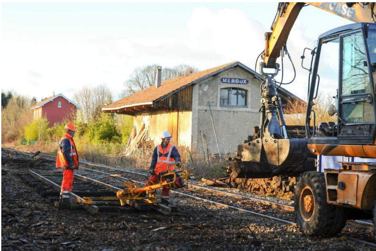
Dépose de voie à Meroux