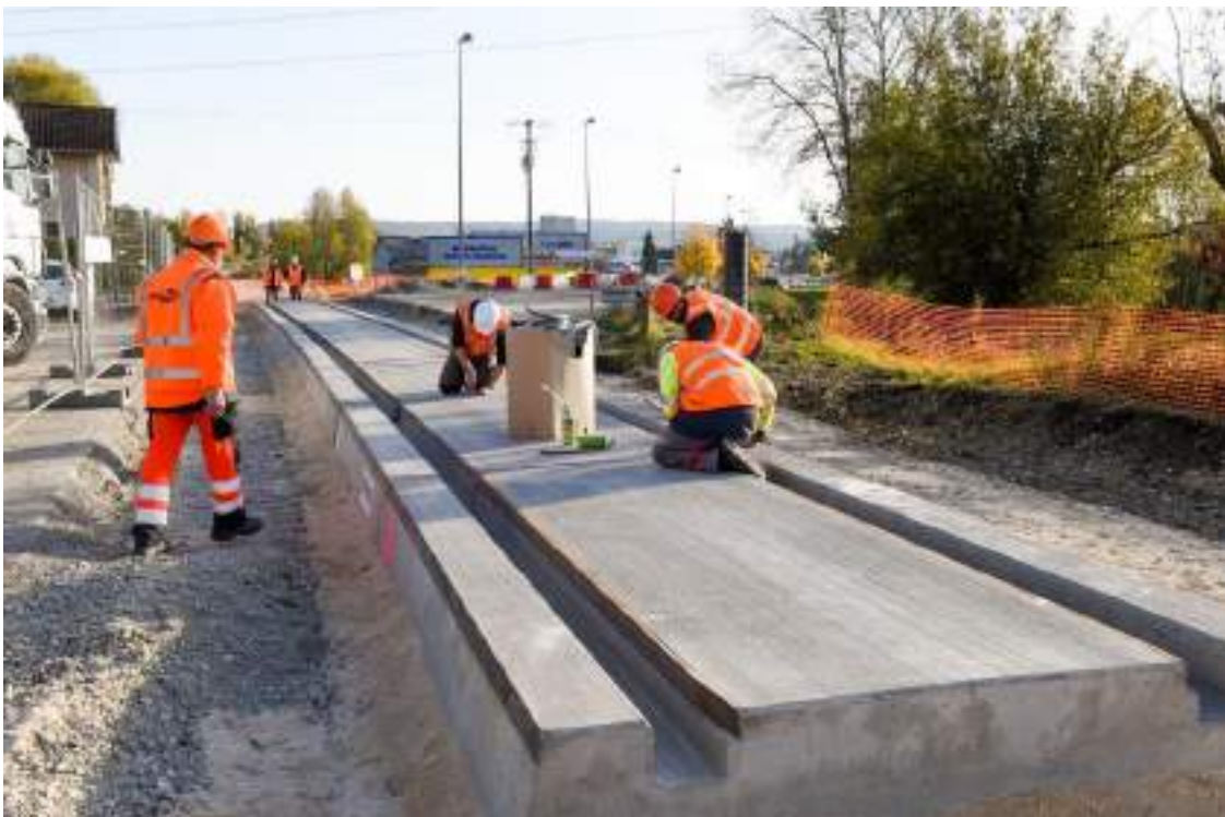
Travaux d'aménagement du PN 22 de Delle

Depuis début 2017, des interventions sont organisées dans les écoles primaires et collèges des communes traversées par la future ligne transfrontalière. Au total, 17 établissements ont participé à cette démarche et plus de 1100 élèves ont été sensibilisés aux risques ferroviaires.