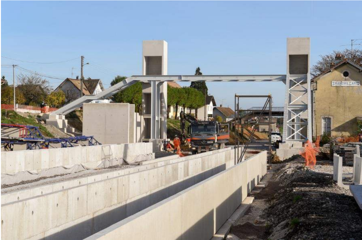
Construction de la passerelle de Grandvillars