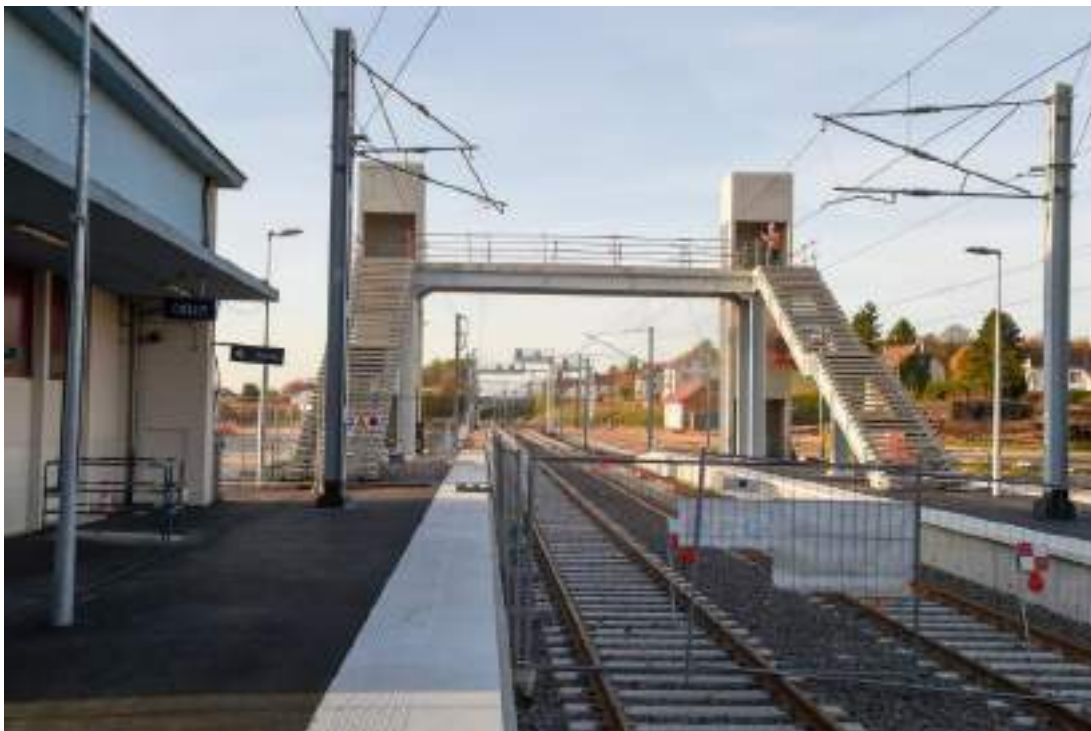
Passerelle de la gare de Delle