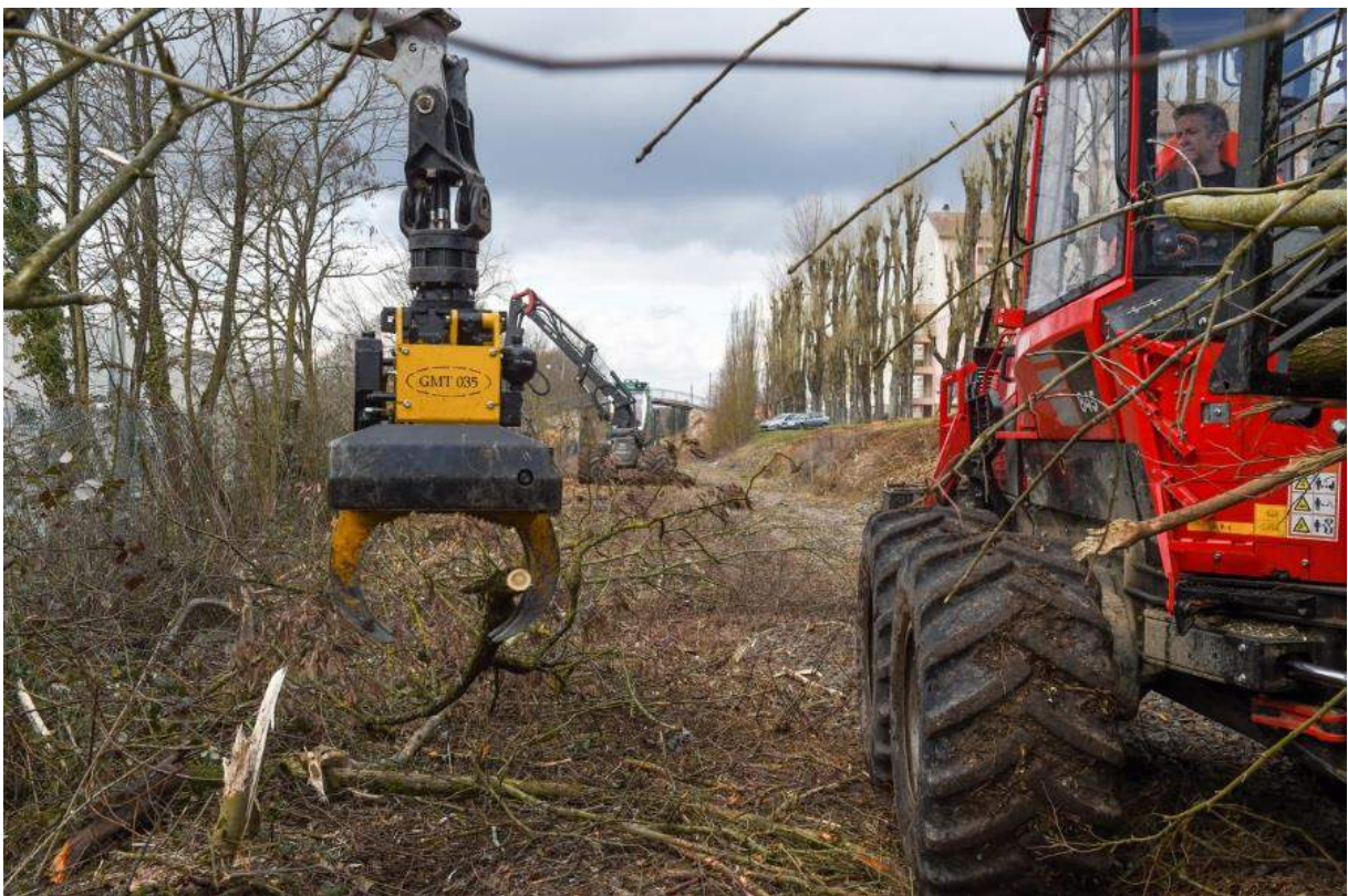
Débroussaillage à Bourogne

Les travaux de terrassement, réalisés par l'entreprise TRANSROUTE, ont débuté au début de l'année 2016, après un travail préalable de nettoyage et de débroussaillage de la zone. Ensuite, une base drainante a été installée ; sa finalité étant de permettre aux eaux de pluie de s'écouler normalement malgré les modifications de terrain induites par les travaux.