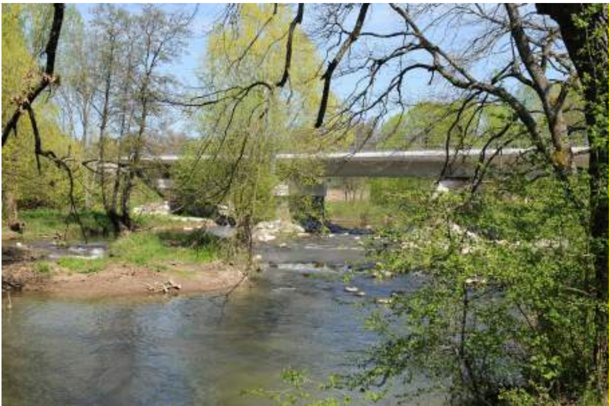
La Bourbeuse et le pont rail de Bourogne

Ainsi, pour la démolition du pont, SNCF Réseau a décidé de créer une piste provisoire directement dans le lit de la rivière la Bourbeuse. Cette plateforme de travaux a permis l'accès direct au plus près de l'ouvrage aux engins de chantier, afin de limiter l'impact sur les milieux boisés longeant la rivière. Le remplacement du pont rail enjambant la Bourbeuse était la phase la plus délicate du chantier au moment des travaux. La collaboration étroite entre l'entreprise de chantier, les responsables environnement de la maîtrise d'ouvrage et maîtrise d'œuvre et les services de la police de l'eau ont permis une réhabilitation du site très qualitative, avec une diversification des milieux favorables au développement de l'ichtyofaune (population de poissons).