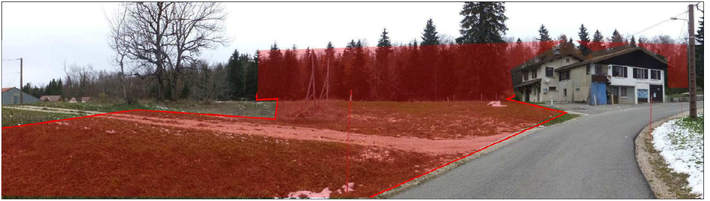
Prise de vue 3 du secteur nord du projet avec le paysage lointain, depuis « la vue du Lac » (prise le 13/11/2014)