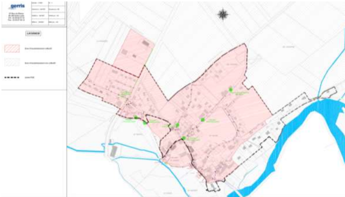
Ancien zonage d'assainissement