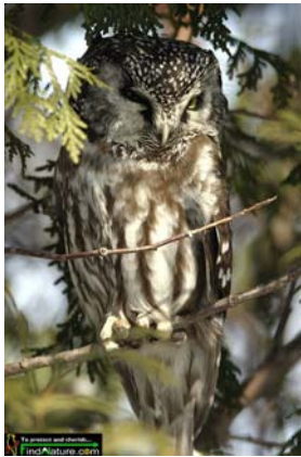
Michel Lamarche www.oiseaux.net