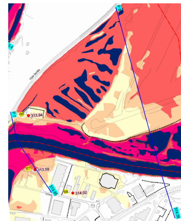
LOCALISATION DES PROFILS DE CRUE 1/10000