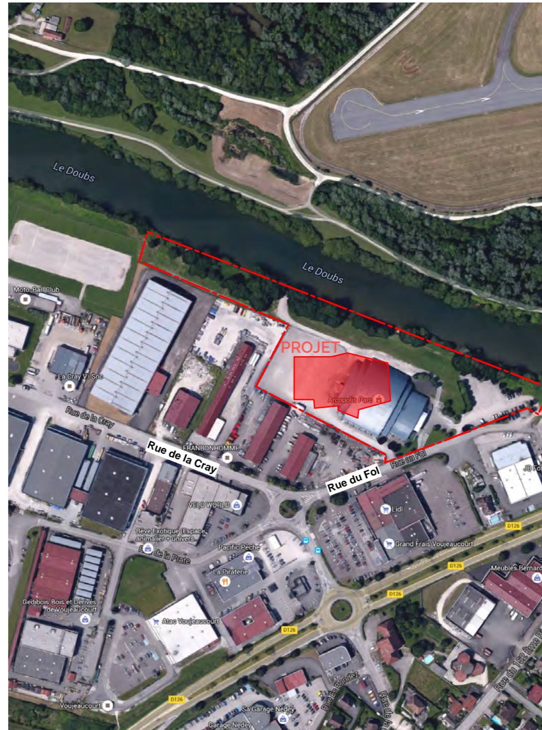
Zone du projet sur le site