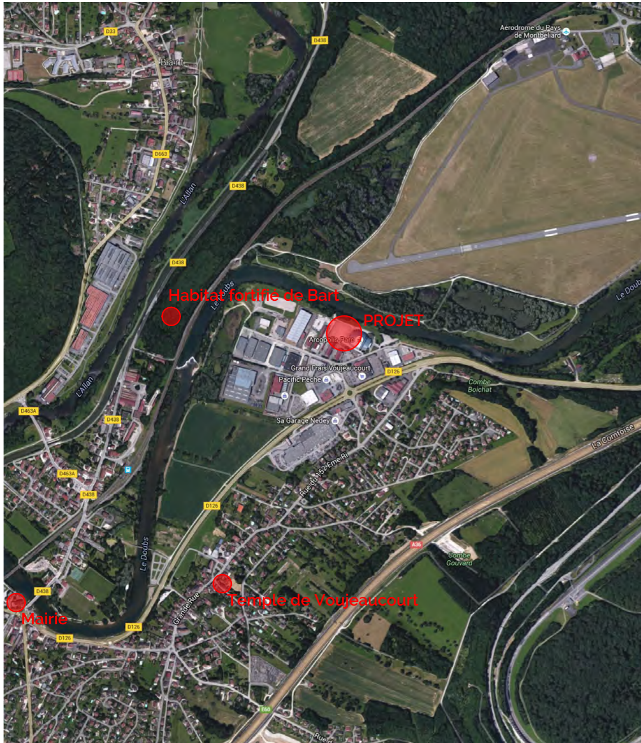
Site de l'ancienne salle ARCOPLIS dans la zone d'activité de la Cray au Nord de Voujeaucourt