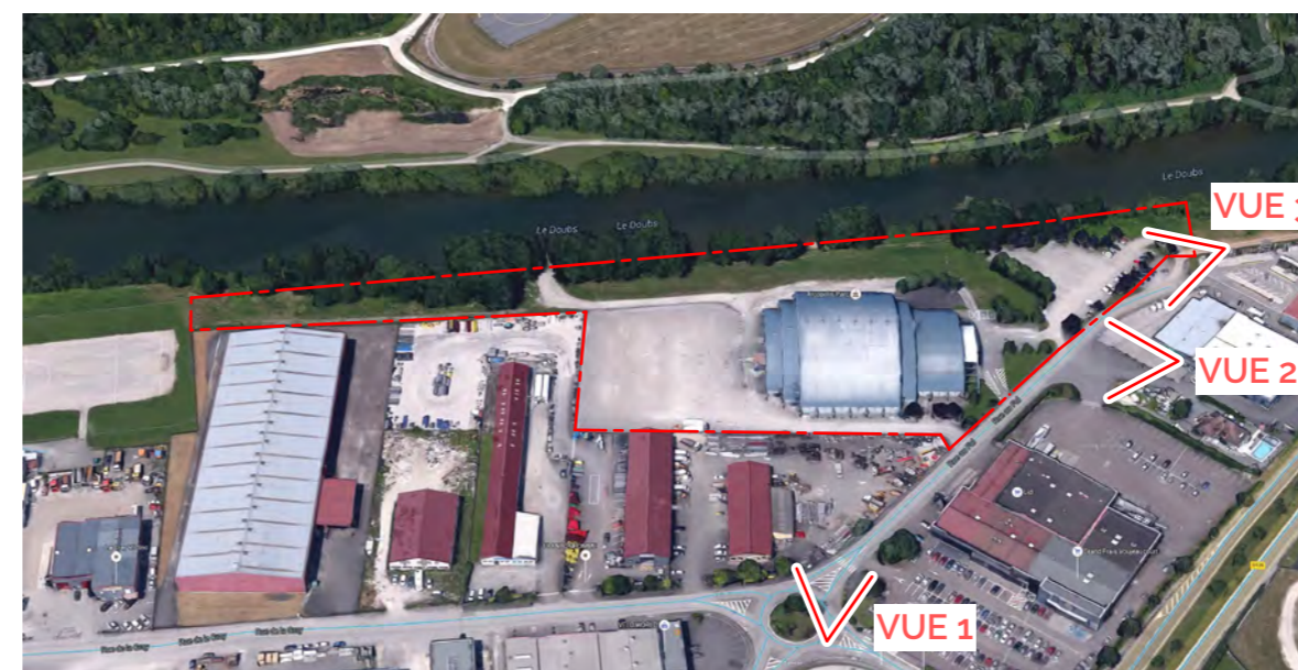
PLAN DE LOCALISATION DES VUES