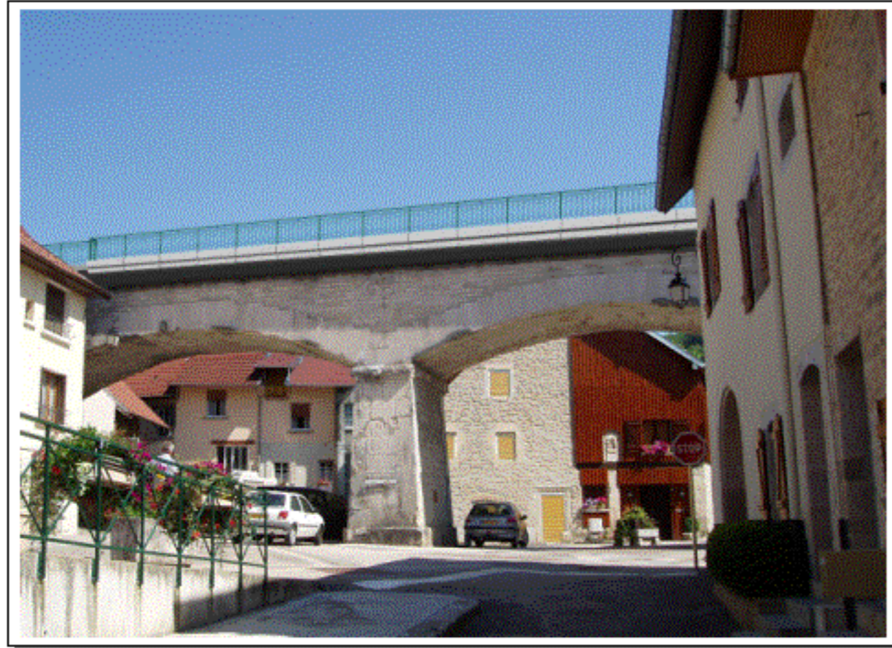
vue depuis la rue des Martinets