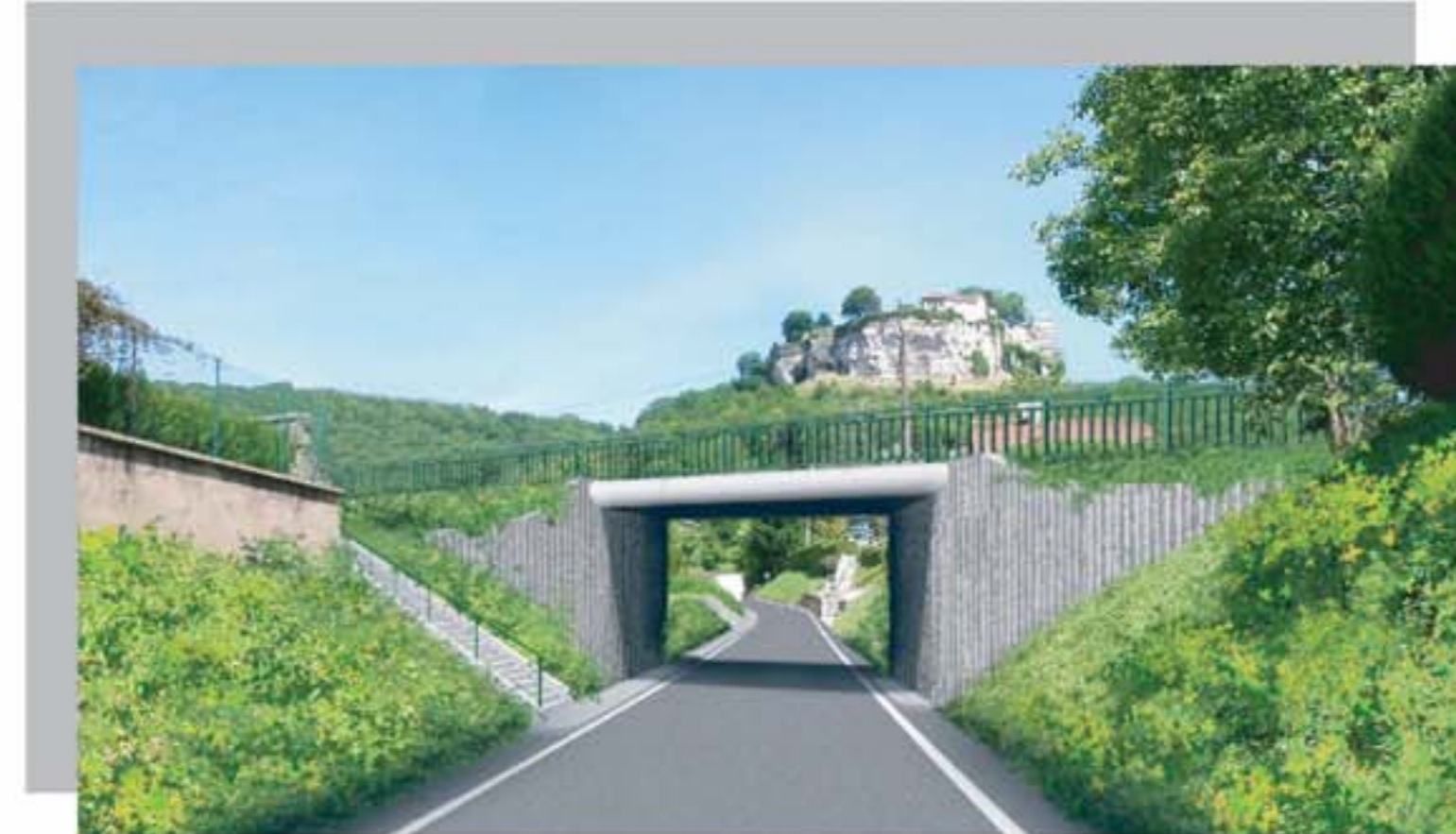
Passage supérieur de la rue du Château