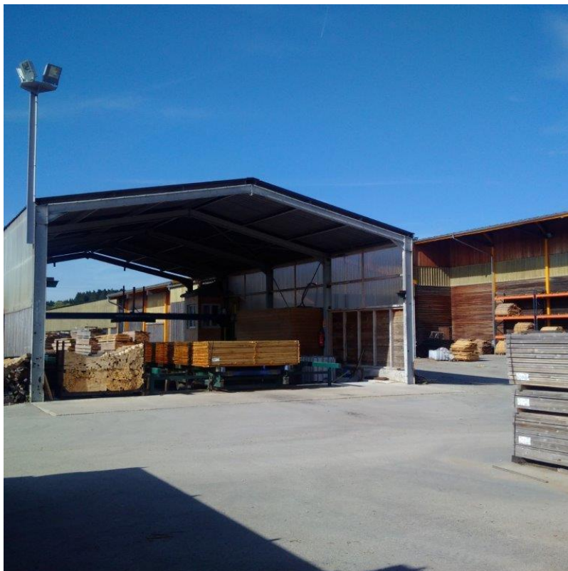
Photo 1 : Vue sur abri de traitement et sur l'emplacement de l'extension sud-est pour stockage – sept. 2017