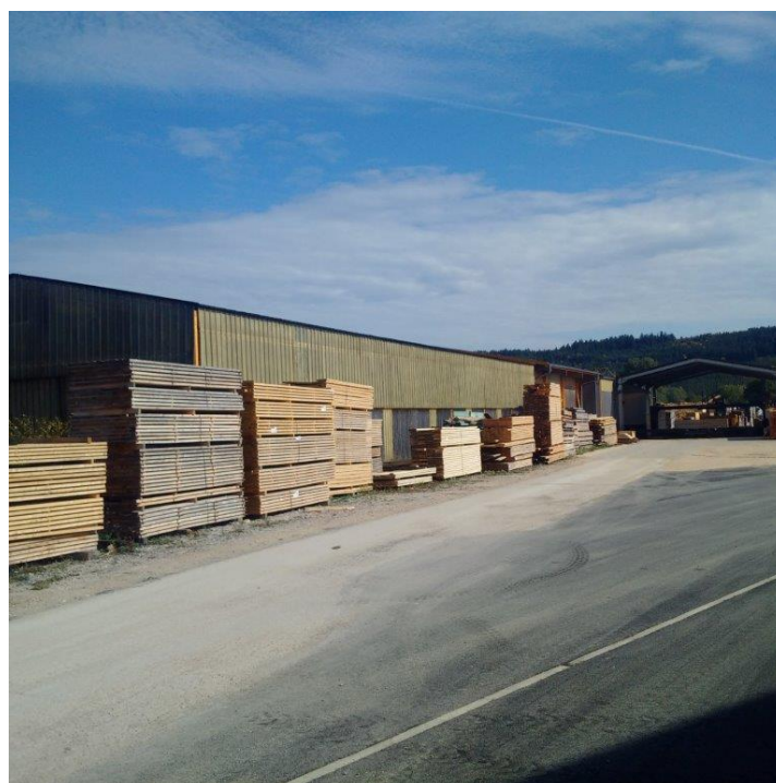
Photo 2 : Vue sur abri de traitement (au fond) et sur l'emplacement de l'extension nord-ouest, ainsi que sur le hall de la ligne de tri (premier plan) – sept. 2017