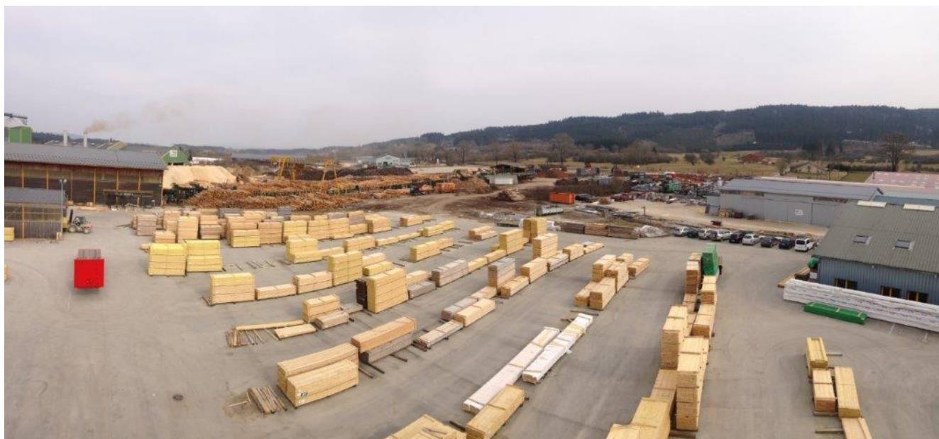
Photo 3 : Vue vers le sud (à gauche : bâtiment de production et abri de traitement ; à droite : bureaux) – Mai 2017