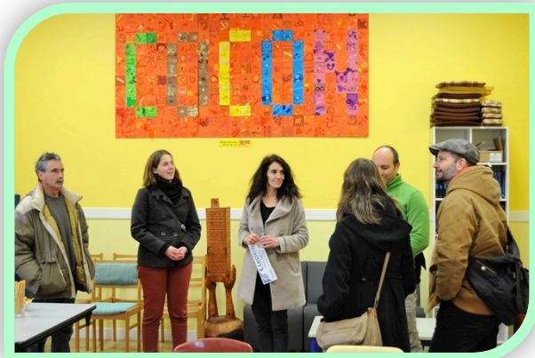
Image : Réunion au cocon

Par le biais d'un ancrage territorial, les Ateliers Nomades ont créé un lien de confiance avec les habitants d'un quartier prioritaire de la politique de la ville et favorisent le développement de leur pouvoir d'agir. L'association participe à la transformation socio-écologique de son territoire en soutenant l'émergence et en accompagnant sur le long terme les initiatives citoyennes.