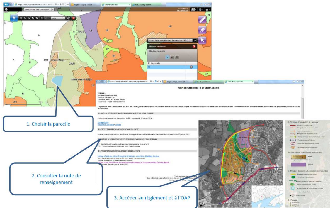
Outil d'information en ligne de Brest Métropole (source: BM)