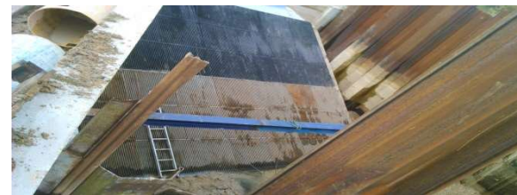
Assemblage de plan de grilles par soudage

19 : Valeur du coefficient K_f selon la forme des barreaux (dimensions en mm), d'après Kirschmer (1926).