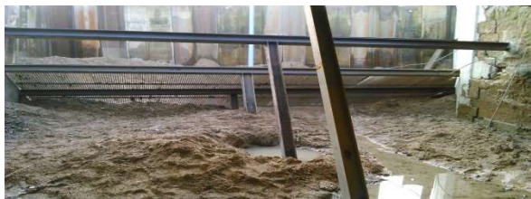
Plan de Grilles pour prises d'eau ichtyo-compatibles