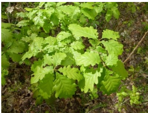
Illustration 5: Semis de chêne

La prise en compte du changement climatique (tout comme la connaissance des maladies frappant certaines espèces, pour certaines favorisées par le réchauffement climatique) est un facteur important au regard du choix des essences à favoriser. Cette question sur la nature des peuplements, leur organisation doit être appréhendée avec circonspection. Toutes les initiatives dans ce domaine (études, recherches, parcelles test, préconisations,...) doivent être encouragées et suivies. Il est en effet important que des enseignements puissent en être tirés, et que les résultats en soient connus. L'identification des zones les plus exposées et/ou critiques vis à vis de cette problématique du changement climatique est un enjeu .