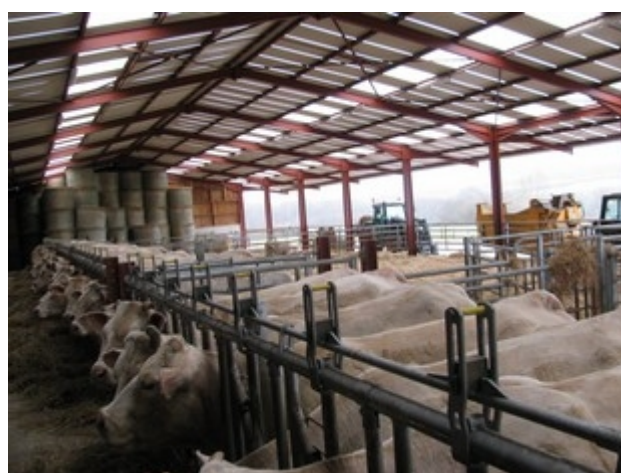
Illustration 8: Étable

Enjeux économiques : La mise en œuvre de cette orientation nécessite que les financements nécessaires puissent être trouvés.