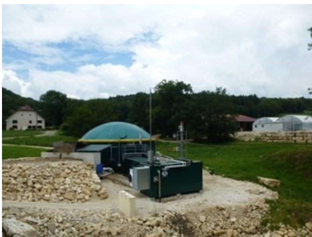
Illustration 1: Méthanisation au GAEC du Puy de la Velle, Villers Saint Martin (25)

Cet usage de proximité n'est certes pas une fin en soi au regard de la mobilisation supplémentaire attendue, mais correspond à une volonté régionale affirmée au regard d'une ressource, certes renouvelable mais néanmoins à terme limitée.