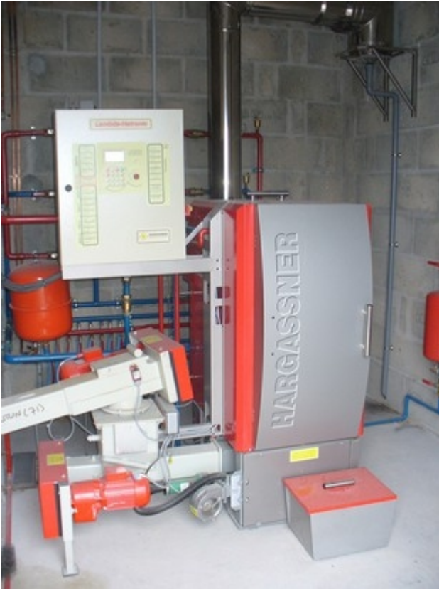
Illustration 3: Exemple de chaufferie de 35 kW