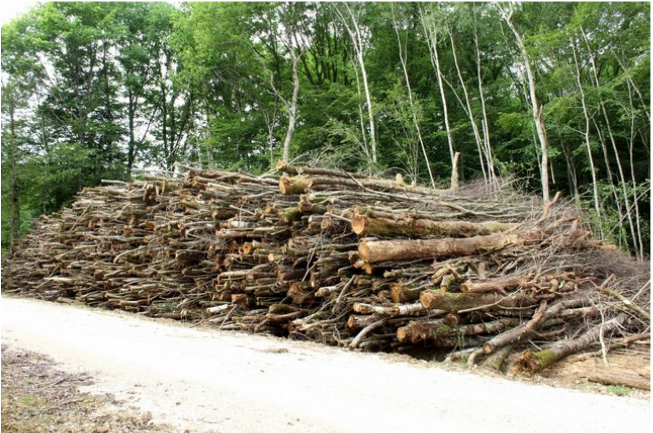
Illustration 2: Stockage de bois énergie (Nièvre)