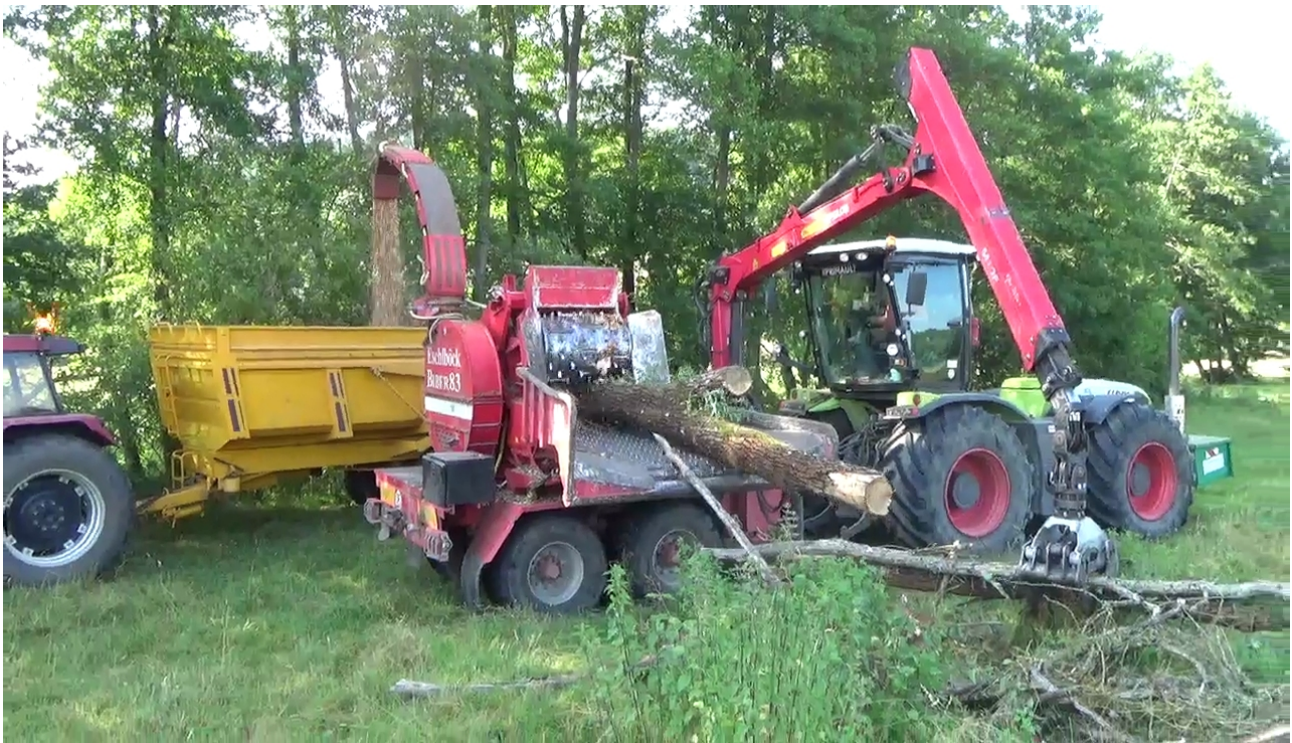
Illustration 9: Entretien de ripisylve dans la Nièvre

Enjeux économiques : Cette action peut permettre d'avoir une maîtrise des coûts de chauffage. La dépense correspondant au besoin de chauffage reste sur le territoire.