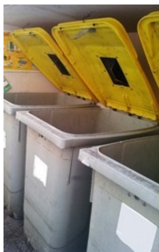
Schéma Régional Biomasse