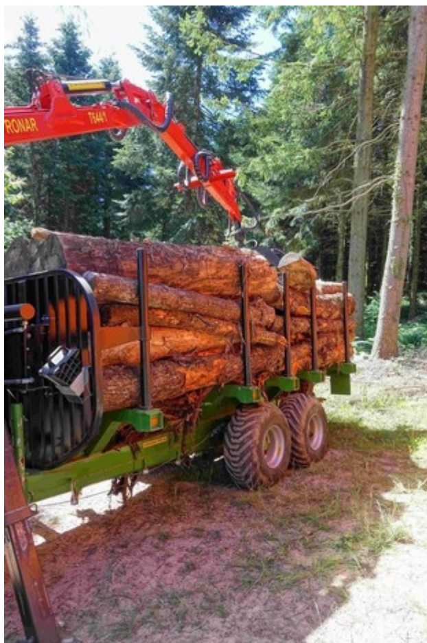
Illustration 4: Engin forestier

Composition chimique moyenne des bois de résineux et de feuillus en zone tempérée (Stevanovic & Perrin, Chimie du bois, 2009).