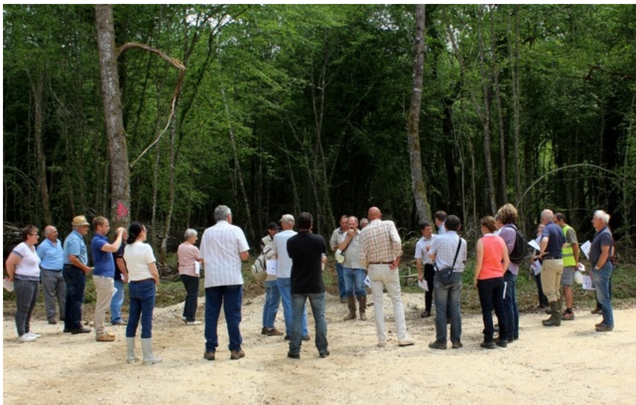
Illustration 6: Participants à une réunion d'animation de la filière bois (Nièvre)

Enjeux économiques : Cette orientation est de nature à garantir une ressource pour le futur, et donc des revenus, à long terme.