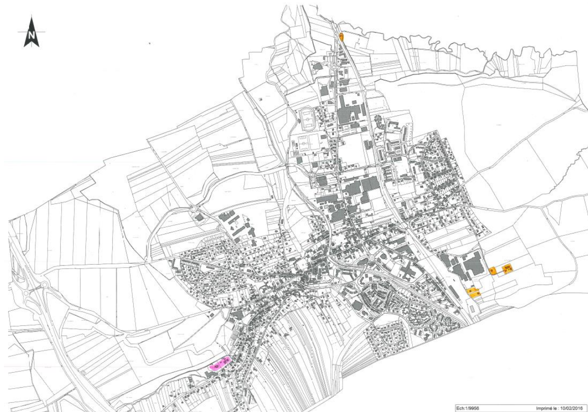
Figure 1 : Commune de Delle- zone d'étude

8 habitations en assainissement non collectif sont recensées au sein de la zone d'étude.