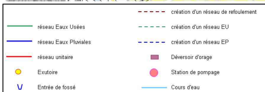
Figure 7 : Scénarii 2 – travaux projetés