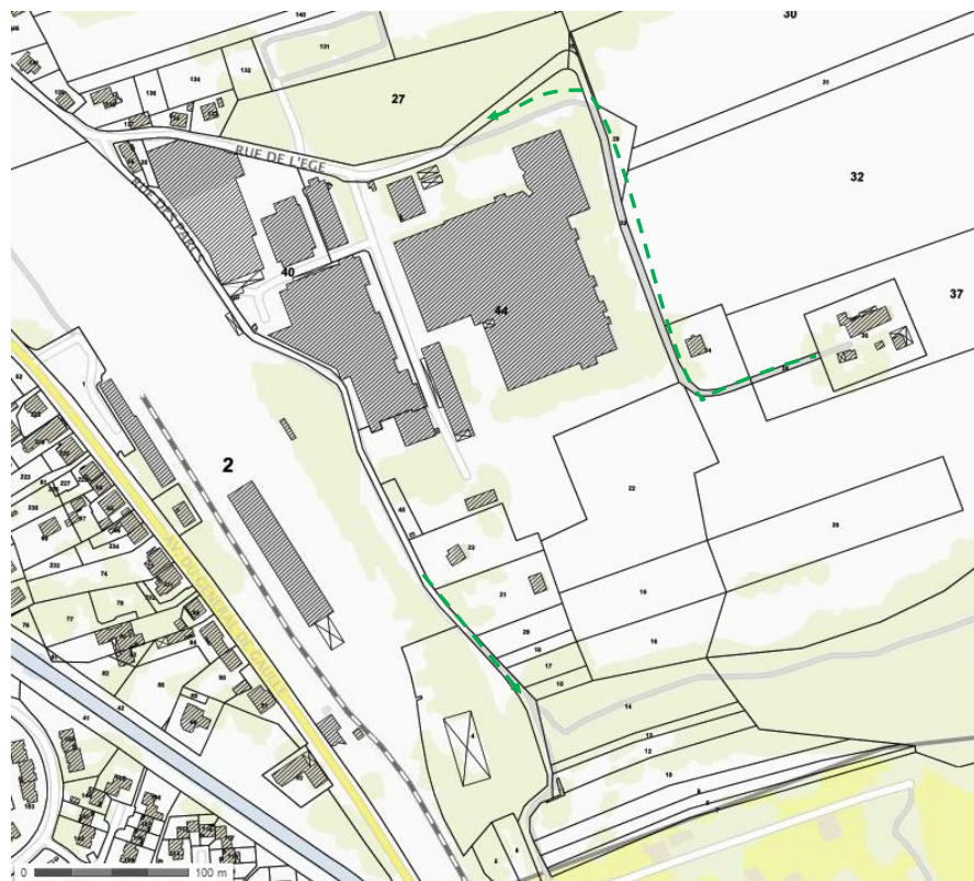
Figure 6 : Scénarii 2 – chiffrage des travaux