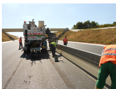
Pose des glissières béton