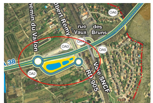
secteur concerné par les alternats de circulation