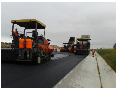
Réalisation des enrobés

Plus que jamais, les usagers sont appelés à la plus grande vigilance à l'abord de la zone de travaux ainsi qu'au respect de la signalisation temporaire mise en place et de la sécurité des opérateurs réalisant les alternats de circulation.