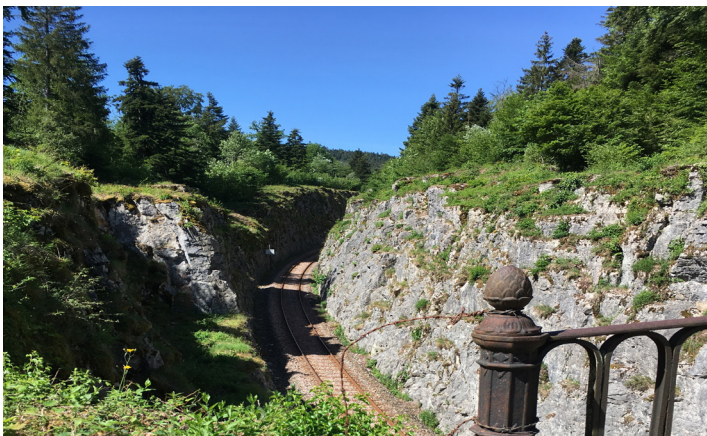
Tranchée du Vaudioux

SNCF Réseau, gestionnaire du réseau ferré national, entreprend des travaux de modernisation sur la ligne des Hironnelles entre Champagnole et Saint-Claude.