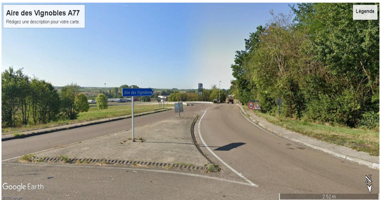
Lieu de rendez-vous : parking dédié au stationnement des véhicules (poids-lourds) de l'Aire des Vignobles (A77)

Lors de cette opération de contrôle, l'attention des Contrôleurs des Transports Terrestres sera portée sur le contrôle du respect des dispositions relatives aux conditions de travail des conducteurs, et notamment les prises de repos hebdomadaires par ces derniers dans leur véhicule, interdites par la réglementation et incompatibles avec la dignité humaine et des conditions d'hygiène respectueuses de leur santé.