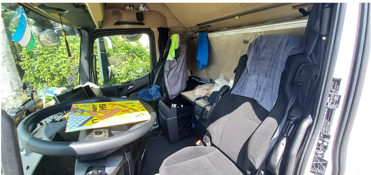
Cabine de véhicule poids-lourd dans laquelle certains conducteurs peuvent passer l'intégralité de leurs repos (journaliers et hebdomadaires) pendant plusieurs mois consécutif

À ce titre, dans un arrêt récent, les magistrats de la Cour de Justice de l'Union Européenne (CJUE) ont tenu à rappeler que « même s'il convient de relever que la conception des véhicules s'est considérablement améliorée au cours de ces 20 dernières années, il n'en demeure pas moins qu'une cabine de camion n'apparaît pas constituer un lieu de repos adapté à des périodes de repos plus longues que les temps de repos journaliers et les temps de repos hebdomadaires réduits. Les conducteurs devraient avoir la possibilité de passer leurs temps de repos hebdomadaires normaux dans un lieu qui fournit des conditions d'hébergement adaptées et adéquates » .