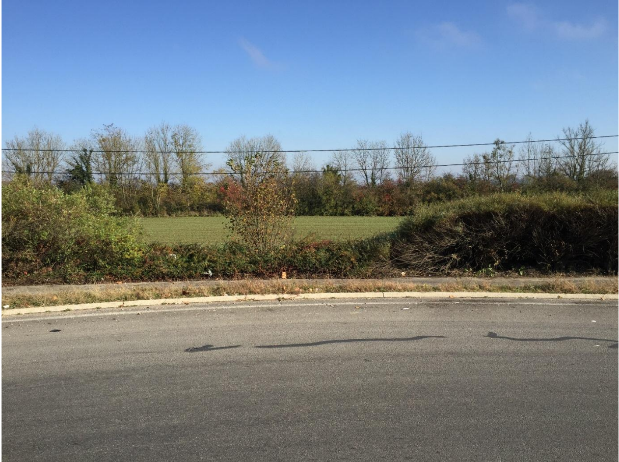
Photographie n°1 : Accès à la voirie nouvelle depuis le rond-point de la RD 905