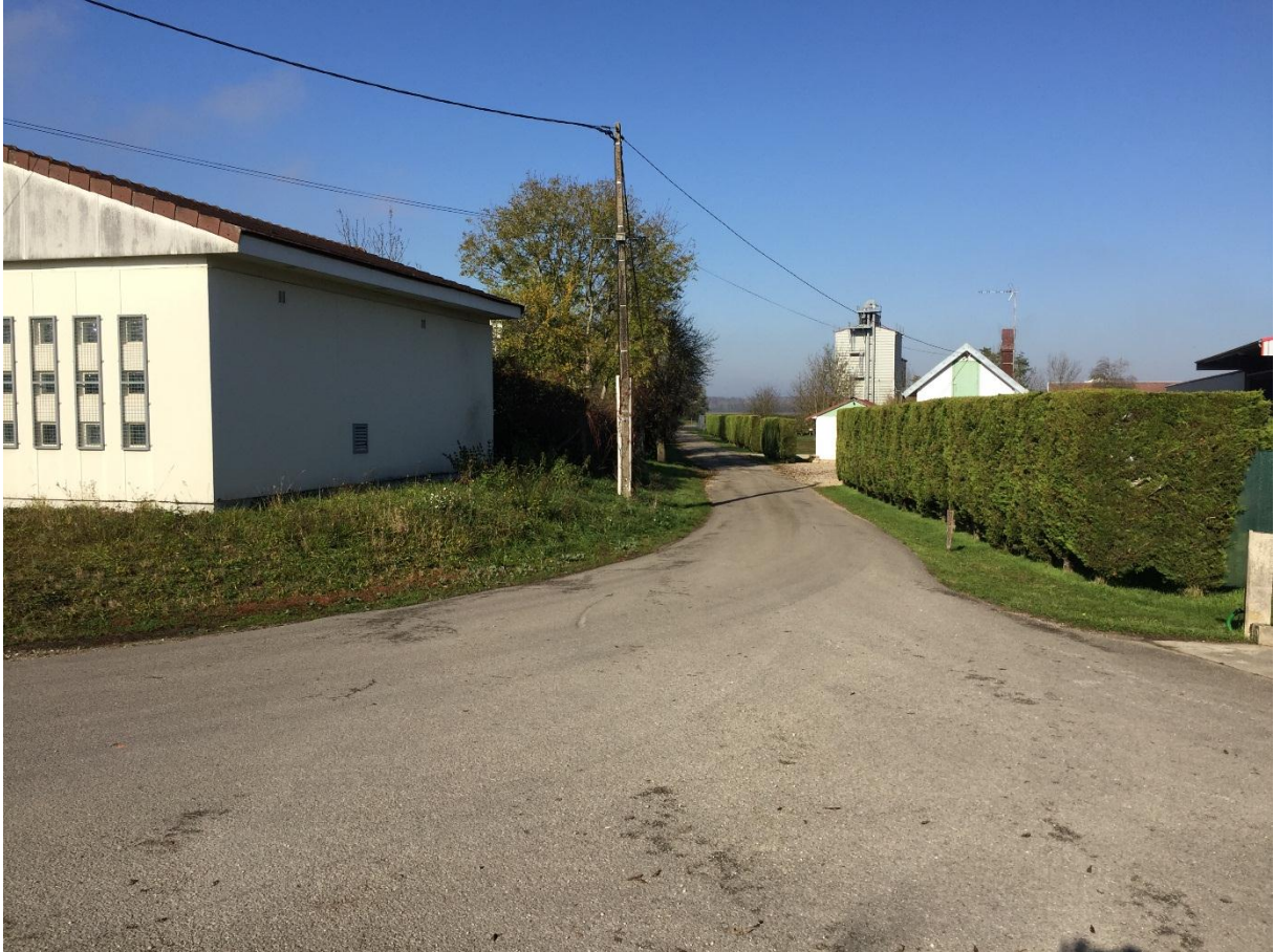
Photographie n°2 : Accès à l'élargissement du chemin des Crotisons depuis la rue de la Loye