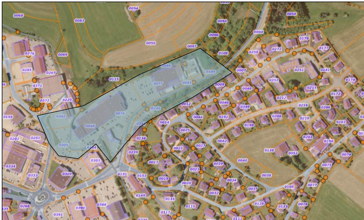
Figure 6. Zone où le site est visible..

Le site n'est pas visible dans un environnement lointain. Ci-dessous la carte de la zone où le site est visible :