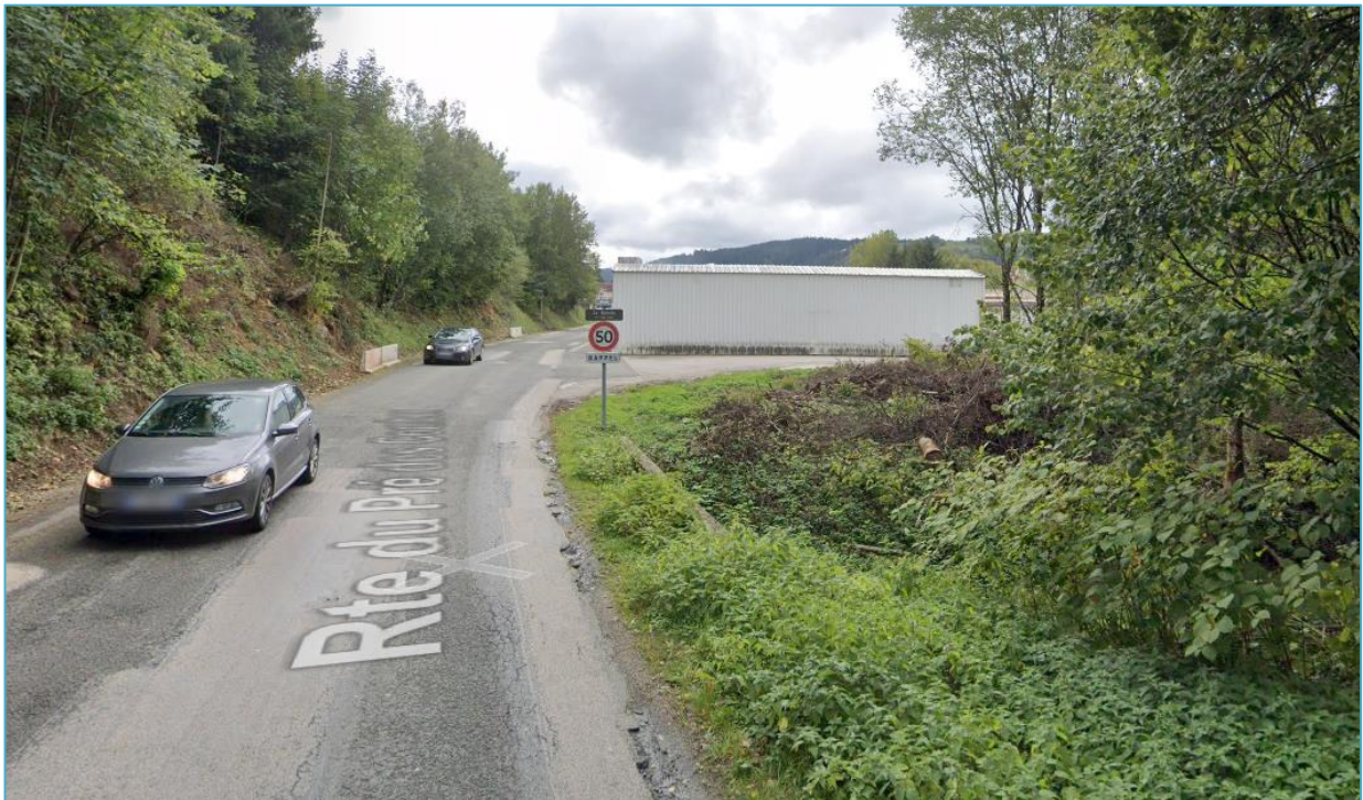
Figure 5. Photographie N°2 (google, 2019).