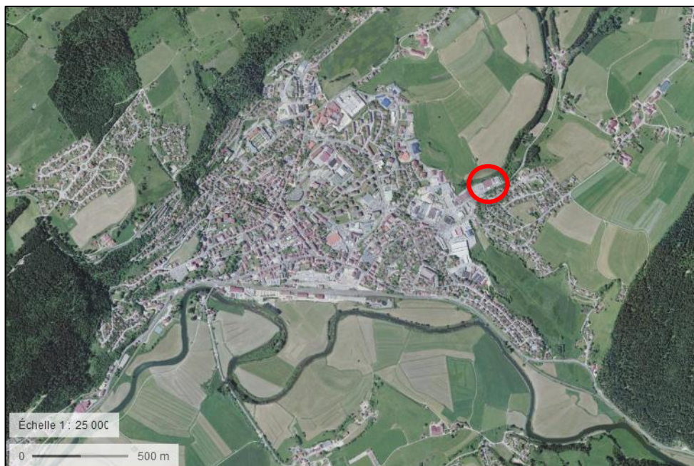
Figure 1: Situation géographique satellite du projet au 1:25000 (Géoportail).