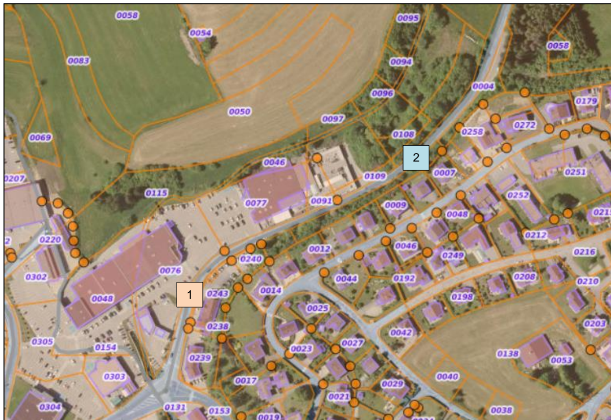
Figure 3. Point de prise de vue des photographies.