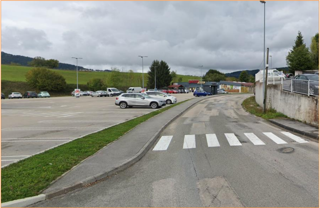
Figure 4. Photographie N°1.