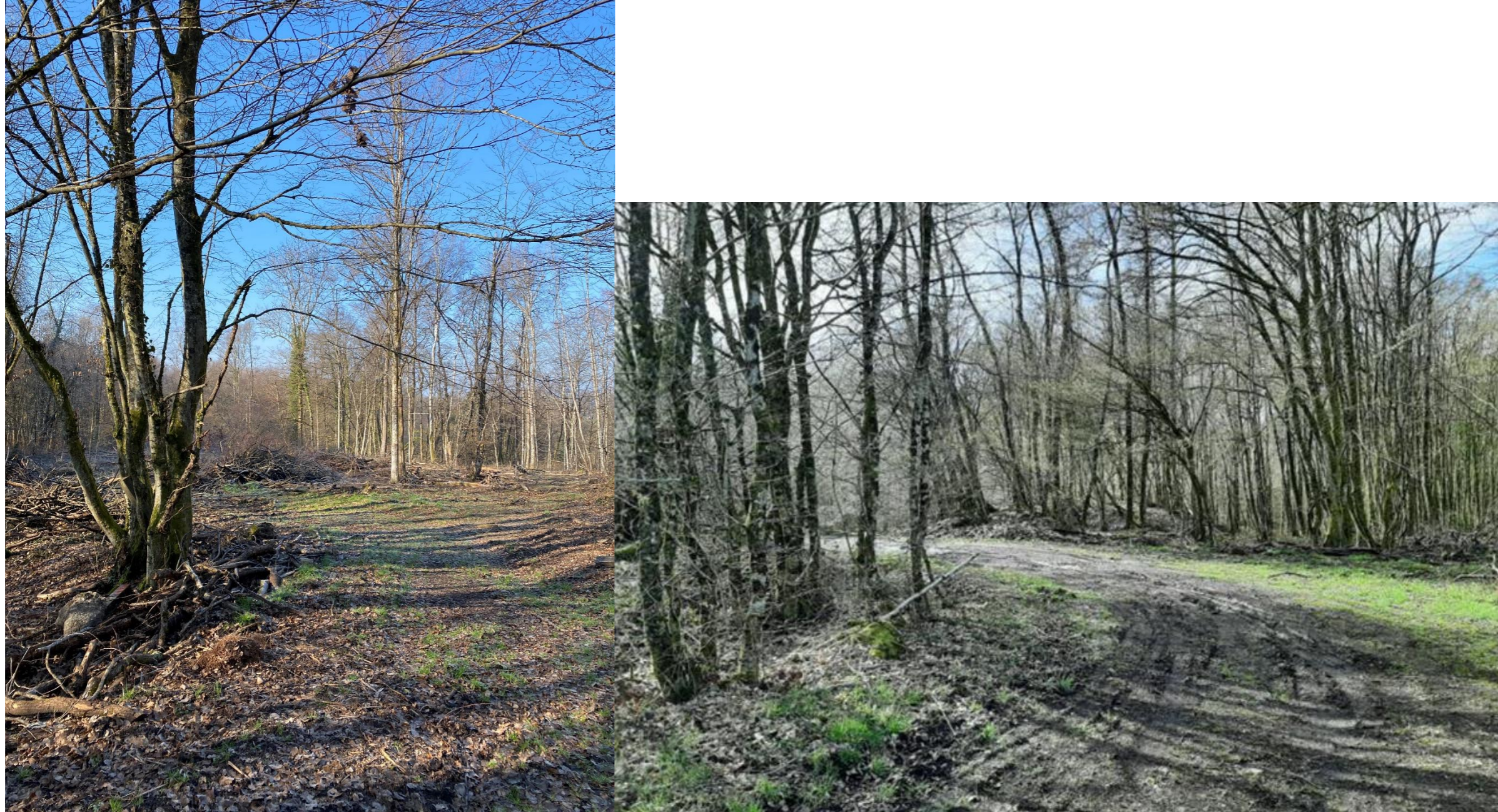
Figure 2 : Point de vue n°3 et Point de vue 4