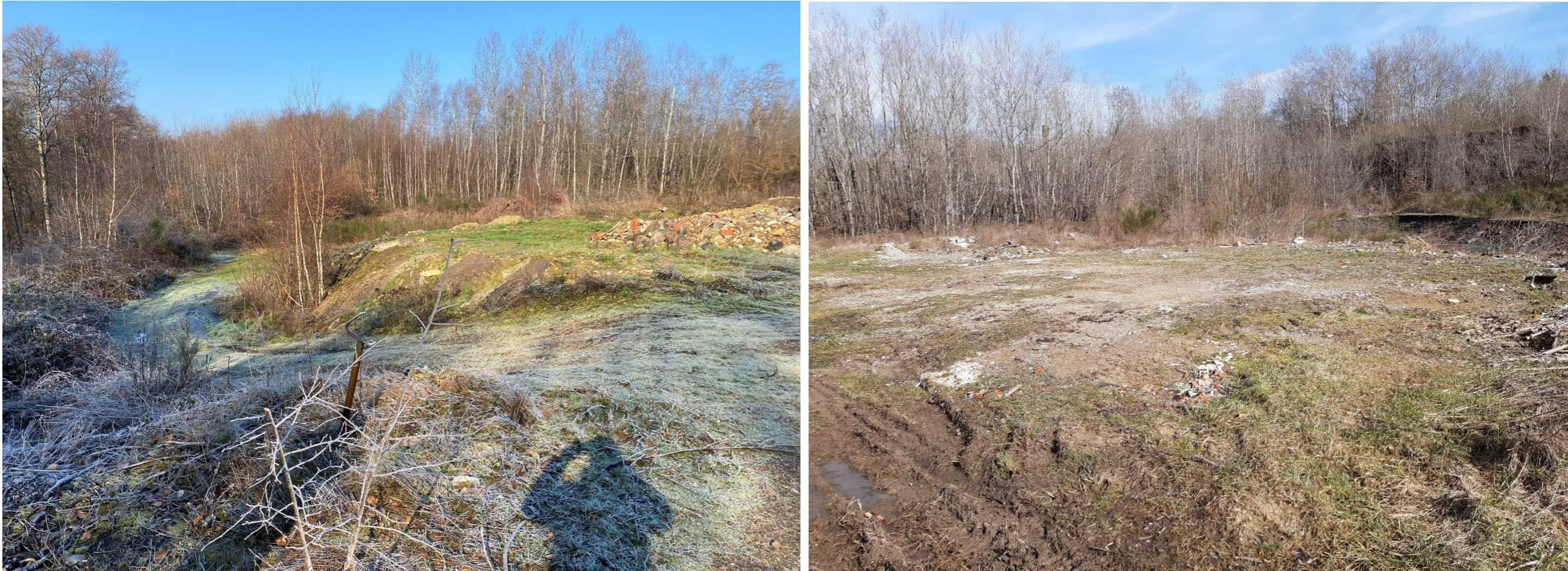
Figure 1 : Point de vue n°1 et Point de vue n°2