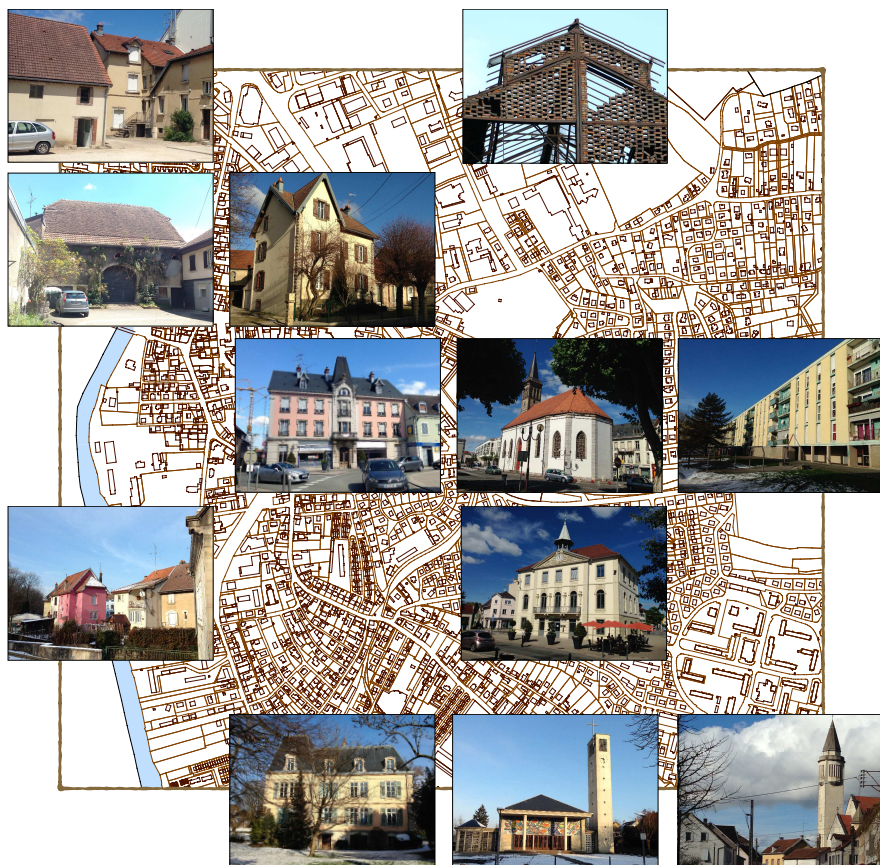
183 ♦ SPR d'Audincourt - Diagnostic