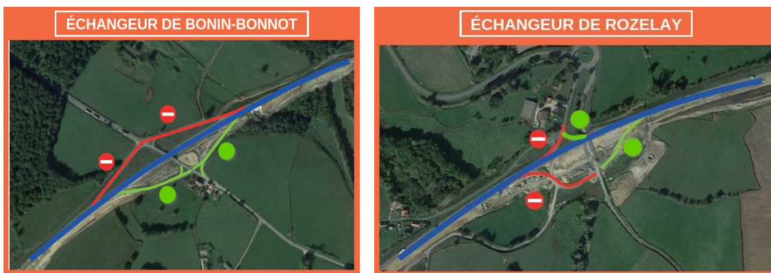
Conditions de circulation du 24 août à début 2024

La vitesse de circulation sur la RN70 dans la zone de travaux sera limitée à 70 km/h, à l'exception d'une zone à 50 km/h à hauteur de l'échangeur de Rozelay. À cet endroit, la chaussée suit une courbe provisoire pour la construction de l'ouvrage sur le ruisseau, un radar de chantier sera mis en place.