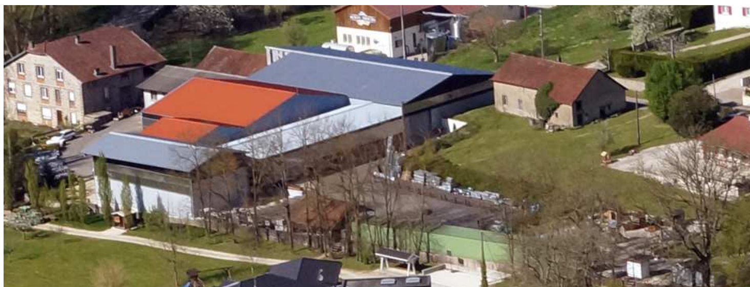
Site de Munans

L'entreprise est spécialisée dans la construction de bâtiments d'élevage aménagés et de stockage. Autour de cette production, nous avons développé des activités de négoce, traitement autoclave, fabrication de charpentes bois, abris de jardin, mobiliers extérieurs. Nous avons 2 sites dans le village : sur Munans un magasin de quincaillerie et d'outillage pour nos consommations mais aussi ouvert au public, sur Larians un site ICPE comprenant une chaudronnerie, un atelier de transformation du bois, un village exposition, un stockage intérieur et extérieur pour le négoce de matériaux.