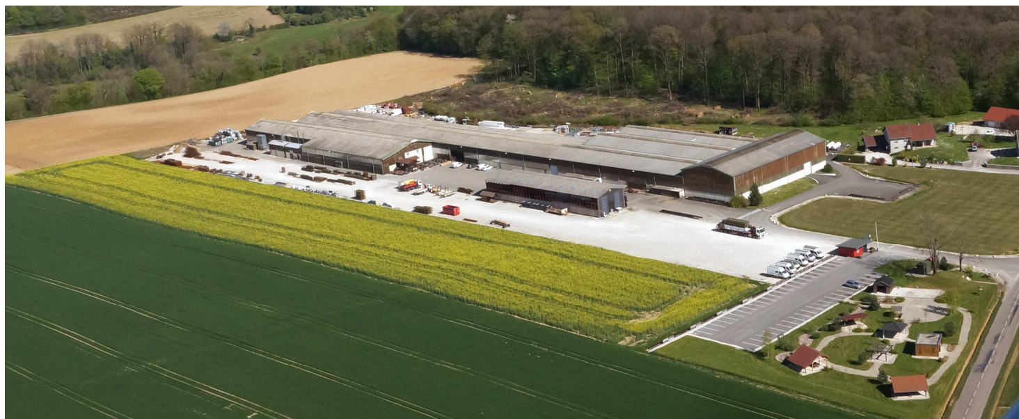
Site de Larians