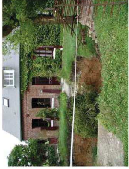
Conséquence d'un affaissement (Somme)

Suite à une modification de l'organisation de l'infiltration et du ruissellement, qu'elle soit naturelle ou anthropique (imperméabilisation des surfaces d'absorption, réactivation de dolines, colmatage de cavités ou injection d'eaux pluviales), le type de fonctionnalité de la cavité en place peut être transformée. Ces modifications fonctionnelles créent un déséquilibre de forces pouvant engendrer des effondrements brutaux ainsi que des affaissements qui auront pour conséquence la ruine de constructions et de possibles victimes. La perturbation des réseaux hydriques peut également créer de nouvelles zones inondables ou amplifier des zones préexistantes.