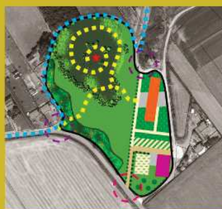
Exemple d'un schéma d'aménagement d'une OAP « sports de nature »

Exemple d'une OAP « sports de nature » :