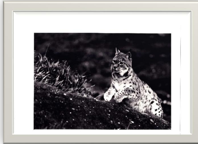
Lynx femelle Hectorine