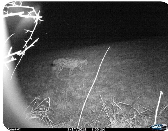
Lynx mâle Palu