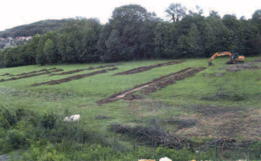
Des sondages pour le diagnostic archéologique ont été réalisés sur les futures emprises de l'échangeur.

Les travaux de l'échangeur RN 57 / RD 1 ont débuté en avril 2011, de manière anticipée dans la perspective de la mise en service de la gare TGV. Des mesures ont été prises pour respecter au mieux l'environnement et favoriser l'intégration de l'ouvrage dans celui-ci.