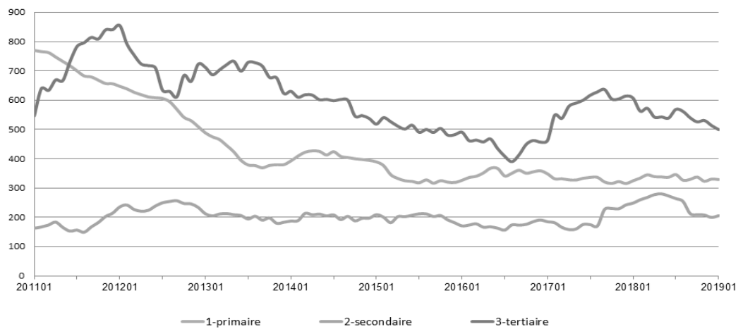
Surfaces de plancher de locaux commencées en milliers de m 2 en région (glissement annuel)