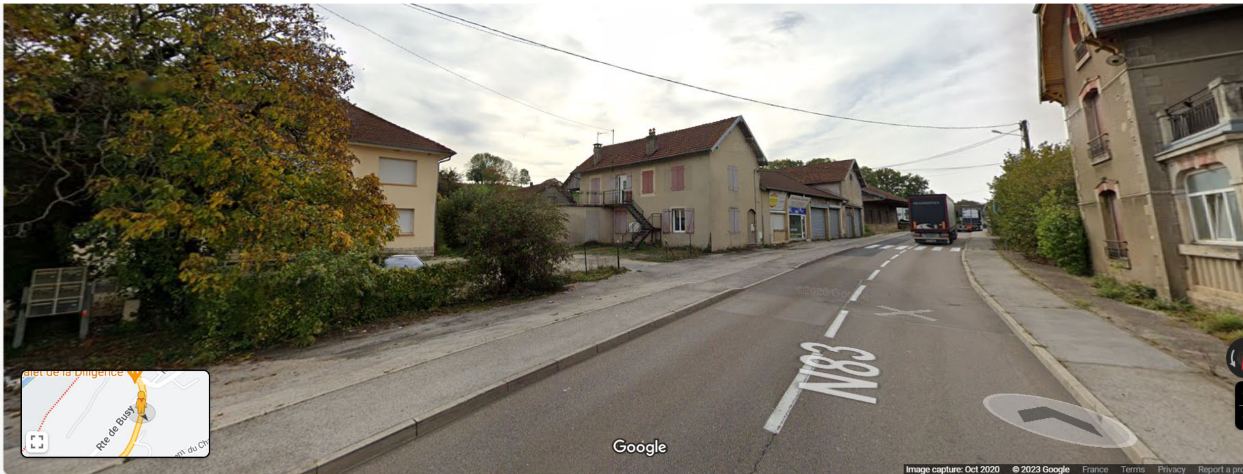
Prise de vue 2, date : octobre 2020, source : google street view (voir annexe 5)