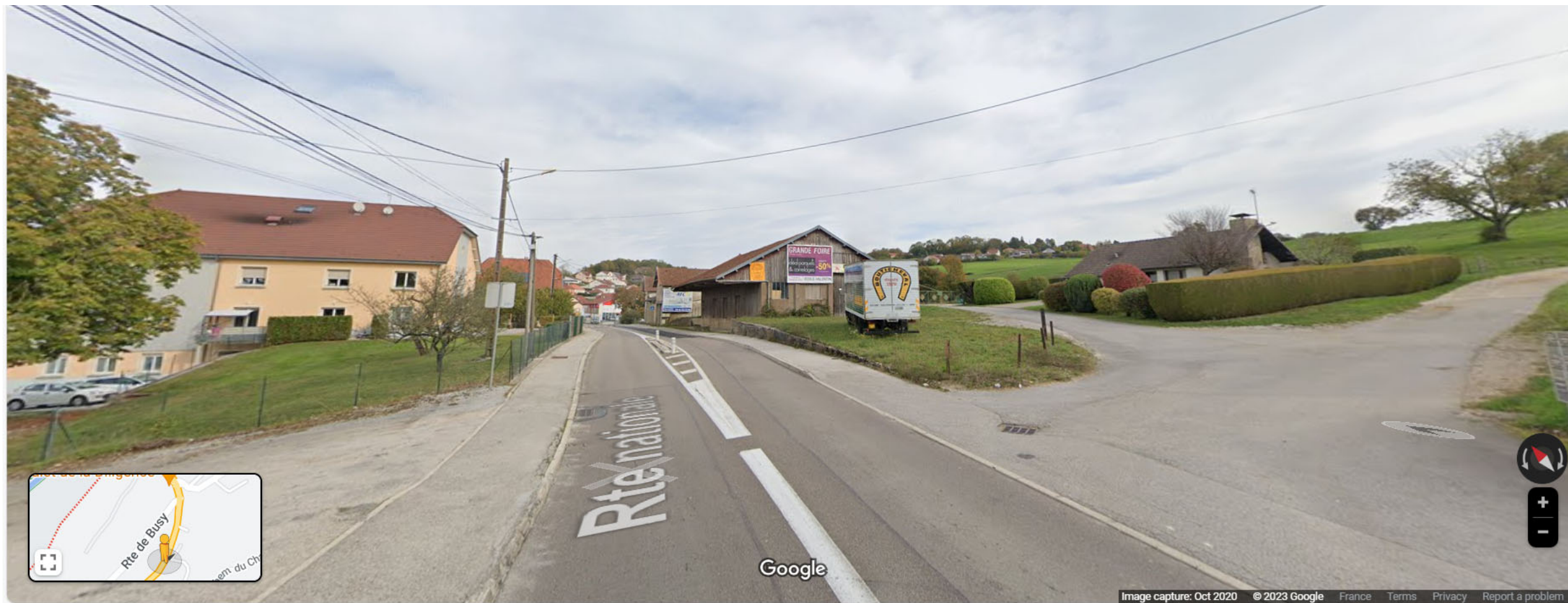
Prise de vue 1, date : octobre 2020, source : google street view (voir annexe 5)