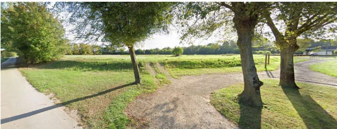
C /Vue depuis le chemin de halage en direction du Sud.

Localisation sur plan de situation cadastral