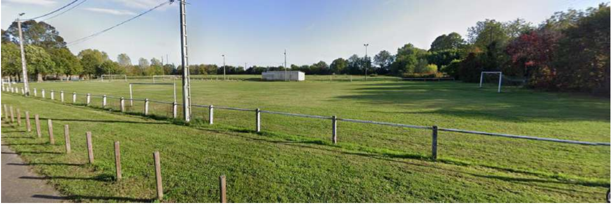
A /Vu depuis la rue du Bac. Le tènement se situe au-delà du terrain de football.