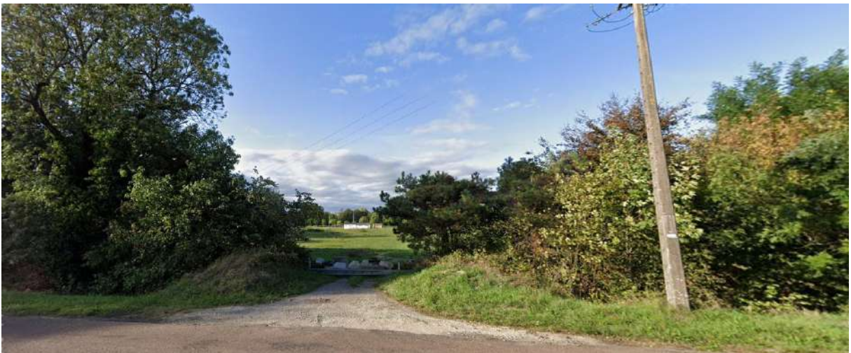
B/ Vue depuis la rue du pont de Boucicaut