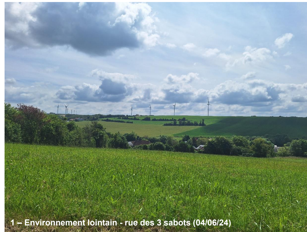
1 – Environnement lointain - rue des 3 sabots (04/06/24)