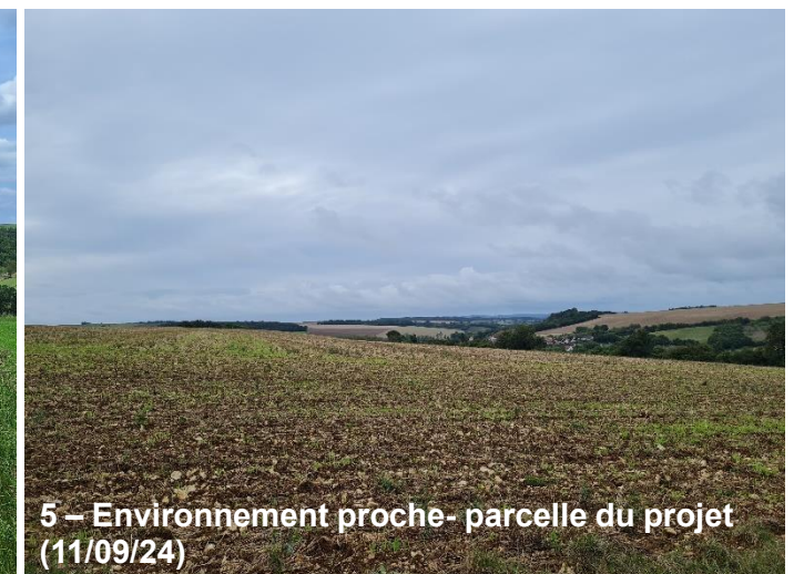
5 – Environnement proche- parcelle du projet (11/09/24)