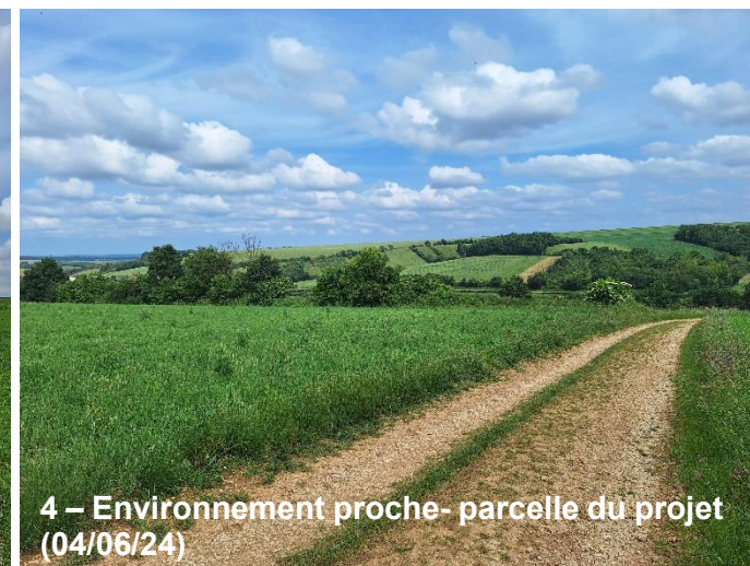
4 – Environnement proche- parcelle du projet (04/06/24)