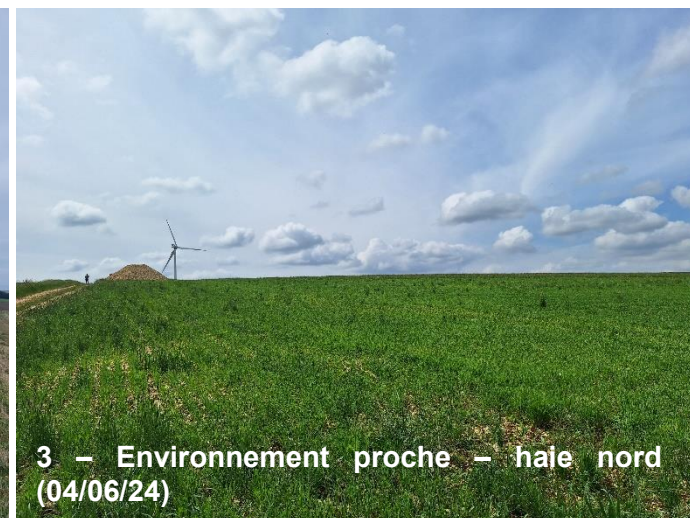
3 – Environnement proche – haie nord (04/06/24)