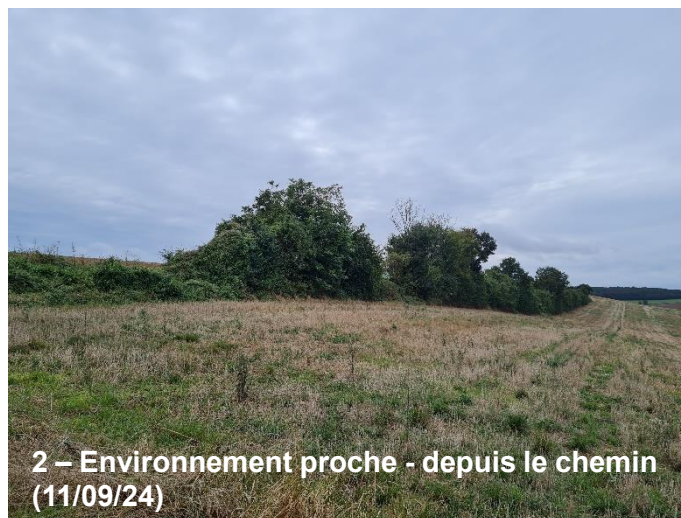
2 – Environnement proche - depuis le chemin (11/09/24)