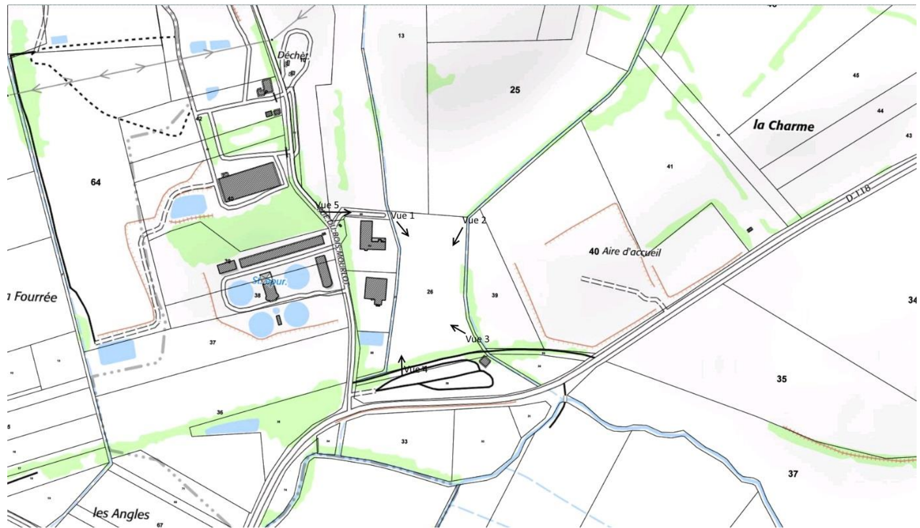
Plan de prise s de vue sur terrain (le 13/02/2017 à 15h)